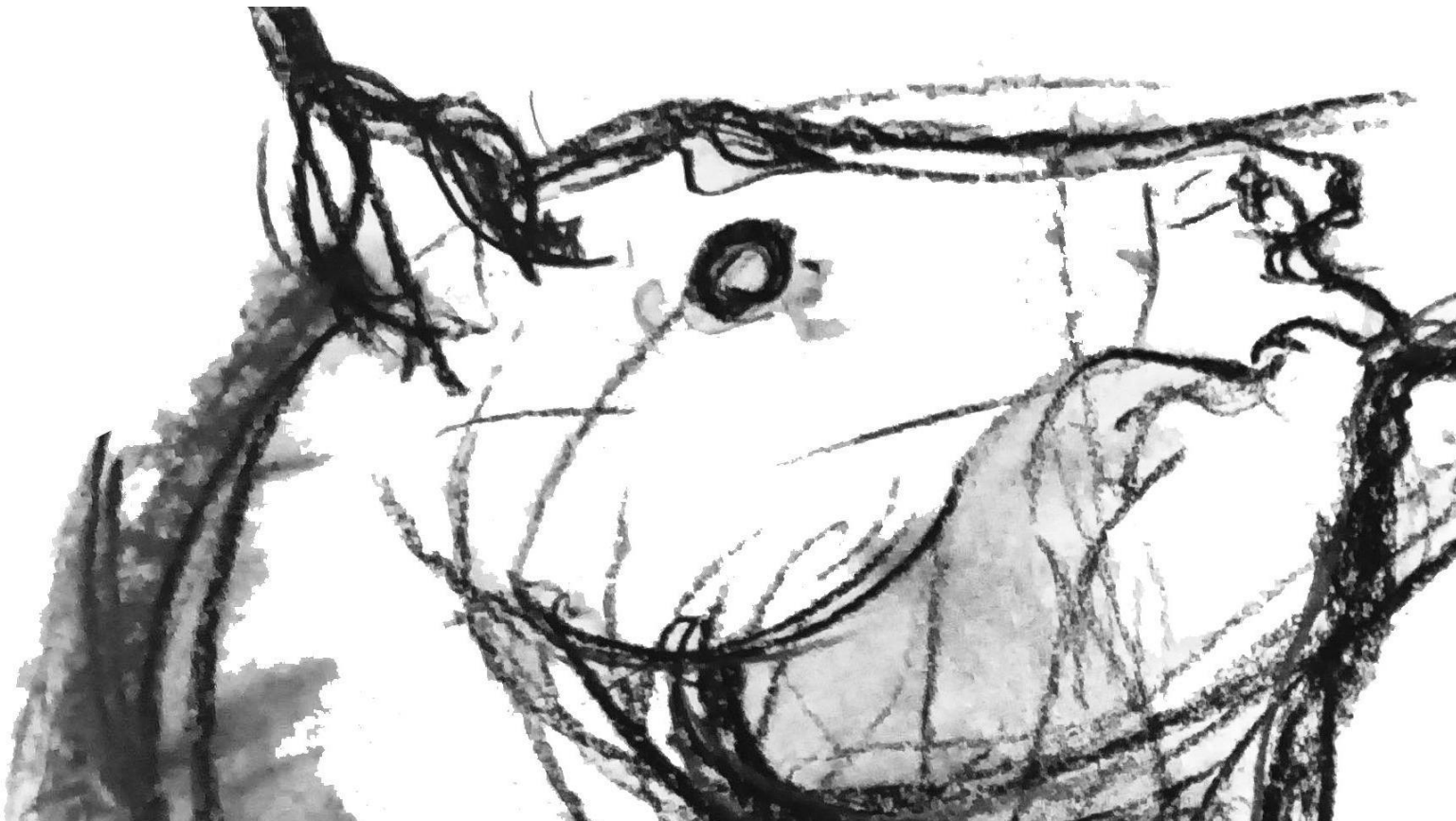
Slika 13. Skica skulpture „Konj”.

U likovnosti animalizam je prozor kroz koji umjetnici, kroz prikaz životinja, govore o svom viđenju ljudskih stanja, situacija, emocija. „Kuja”, iako je široko možemo staviti u prostor animalizma, u njega spada samo obličjem. Njen opis nadilazio bi to određenje, ona je prije svega vezana uz materijal od kojeg je sačinjena i vezana je uz pojam vremena. Konj u svom opisu, u svojoj kompleksnosti pojmova, konceptualno nema značenja medija materijala. On može biti od drveta, kamena, metala, tkanine.