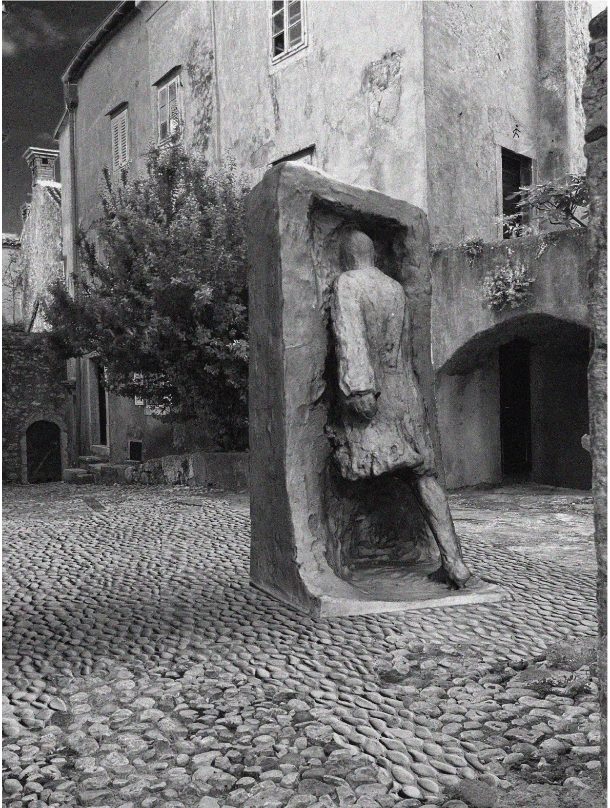
Slika 9. Fotomontaža „Kapar” u prostoru.