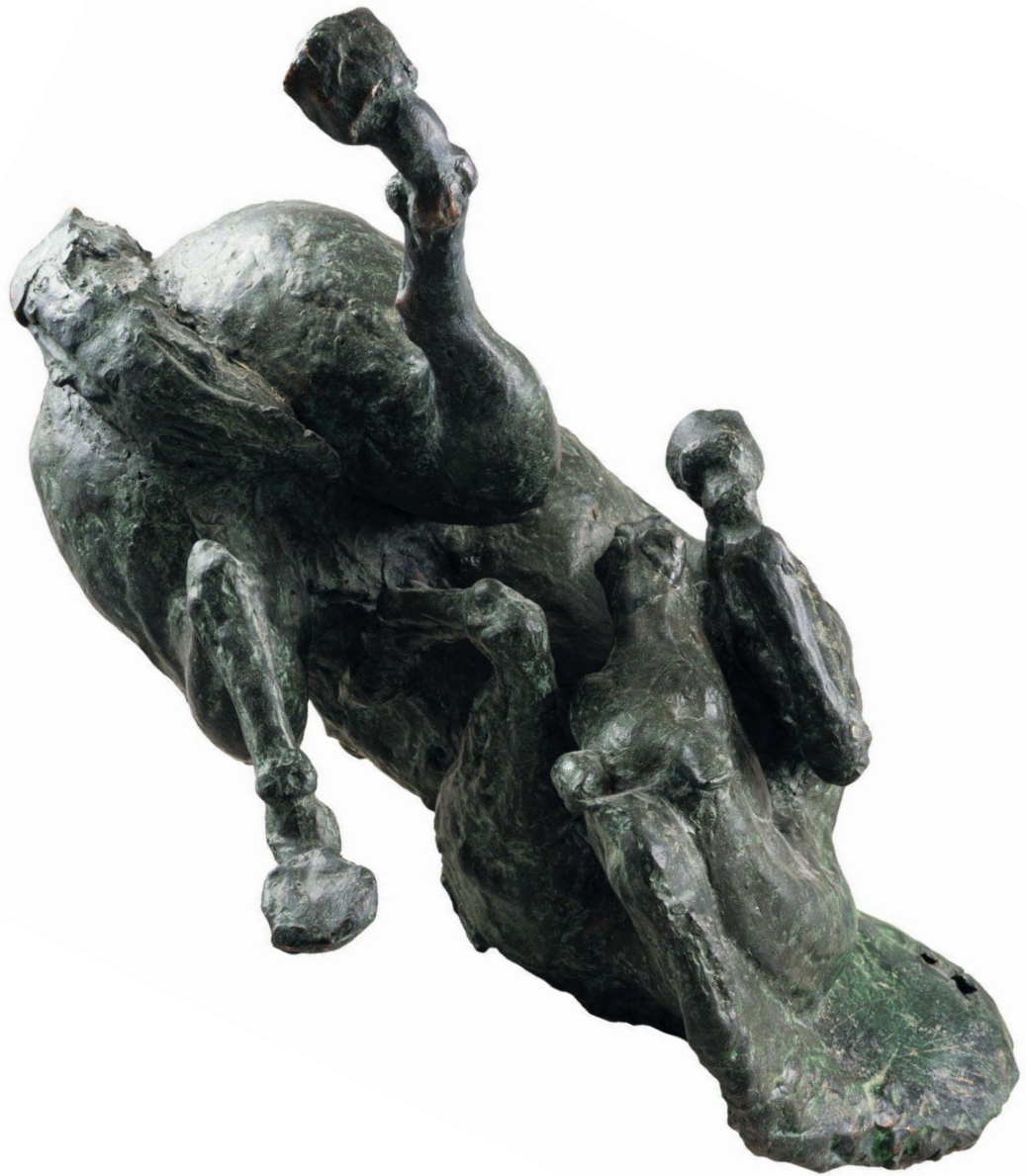
Slika 15. Skulptura „Konj“