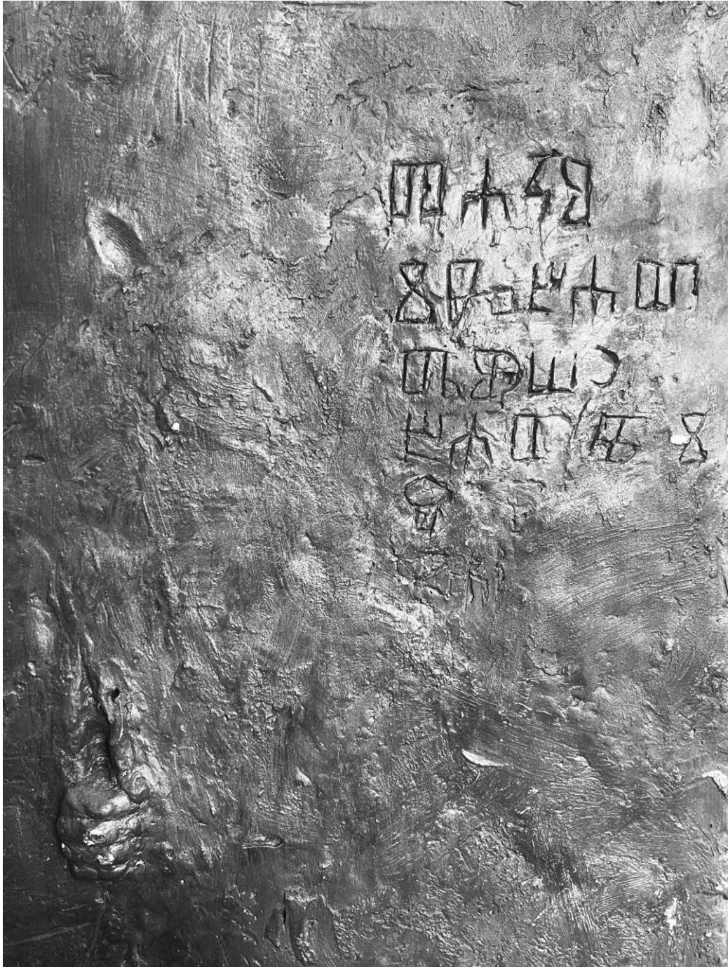
Slika 7. Boceto „Kapar”, detalj.