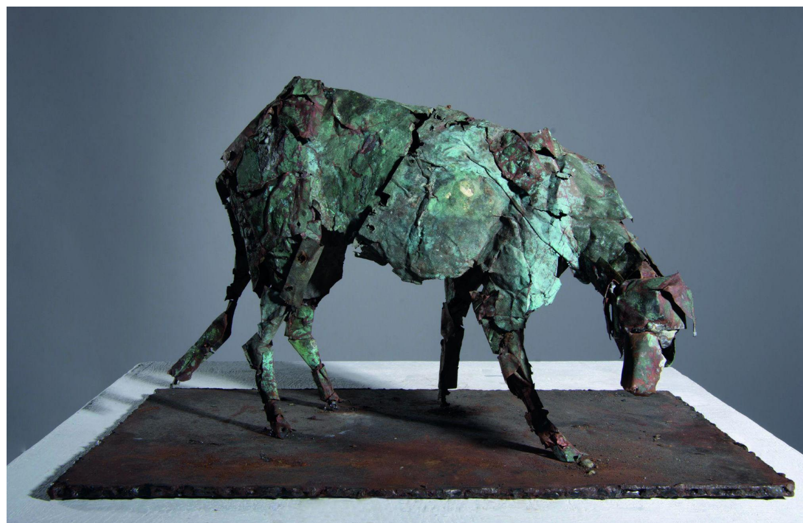
Slika 12. Skulptura „Kuja”

taktilan, reakcija naših osjetila na dodiruto, viđeno, ali i posljedica čitanja tog dodira, kulturoloških značenja i slojeva koji kreiraju informacije i iz kojih iščitavamo znanja i činjenice o materijalu s kojim smo u kontaktu. Vrijeme je u ovom slučaju u materijalu, to je prvi motiv koji je potaknuo čin stvaranja „Kuje” jer kako bi se najplastičnije prikazala sinteza protoka vremena i pohabanog, zamorenog materijala, nego kroz živo biće koje je pritisnuto težinom sedam atmosfera - utegom vremena, poviješću i njenim olujama, kišama, gromovima. Svi ti materijalni propadajući elementi i njihov ljudski doživljaj opterećuju kreaciju i spoznaju svoje smrtnosti - čine je krhkom. „Kuja” jedva živi, krhka je, utroba joj pohabana, kao i materijal od kojeg je sačinjena.