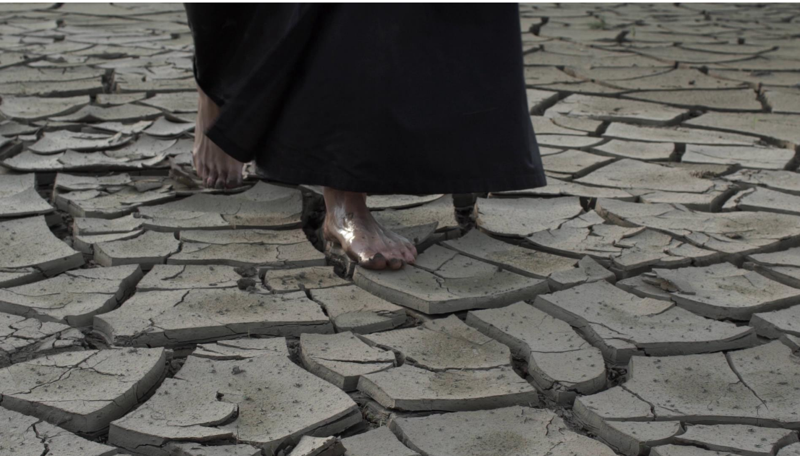
Slika 16. Kadar iz filma „Braća Karamazovi; Knjiga VI”.

Aljoša pokušava razumom prodrijeti u transcendenciju koju nikad neće i ne može spoznati, nama smrtnicima ona nije dohvatljiva, a njena pravda nama je nejasna.