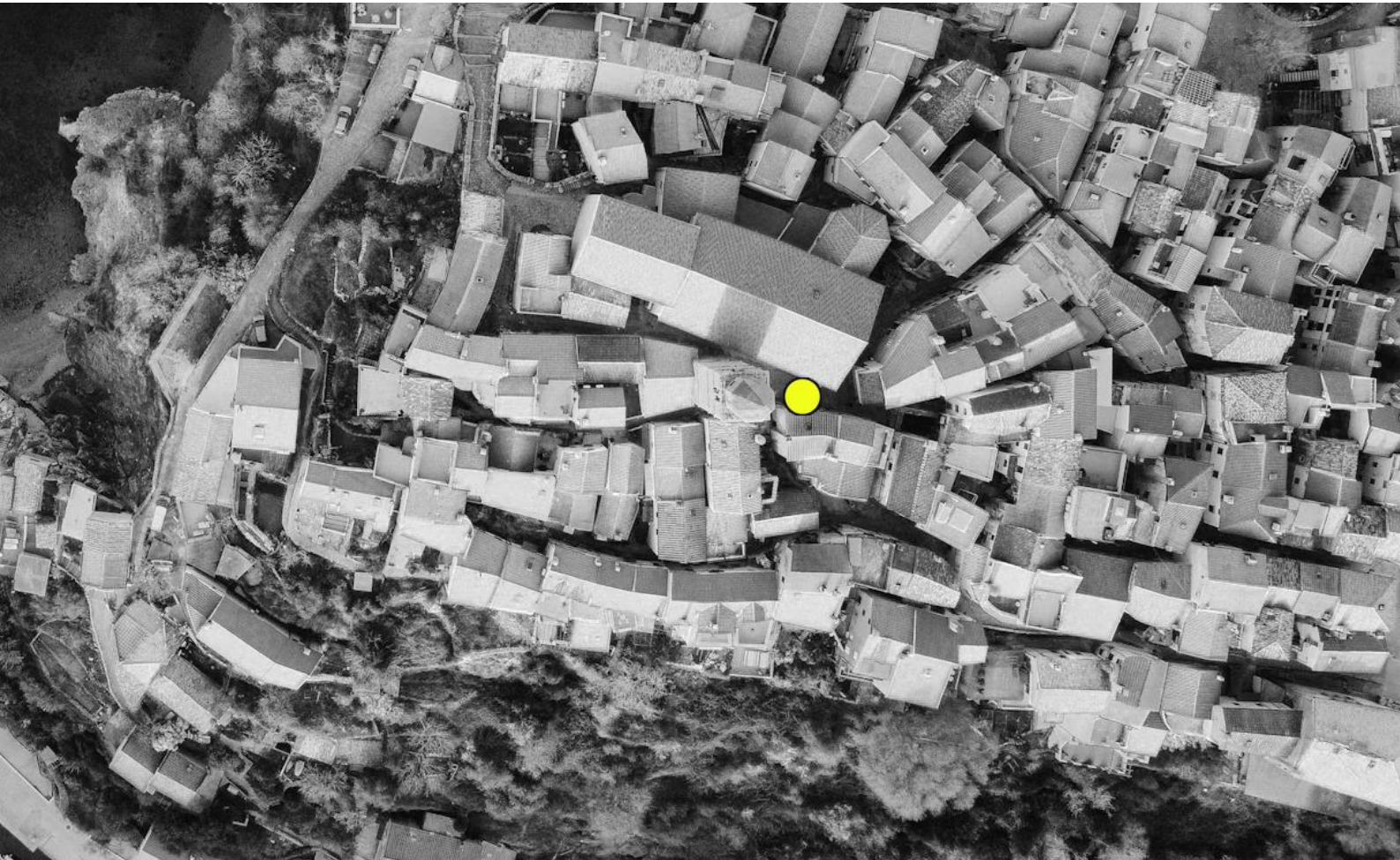
Slika 3. Vrbnik, pozicija skulpture u tlocrtu.