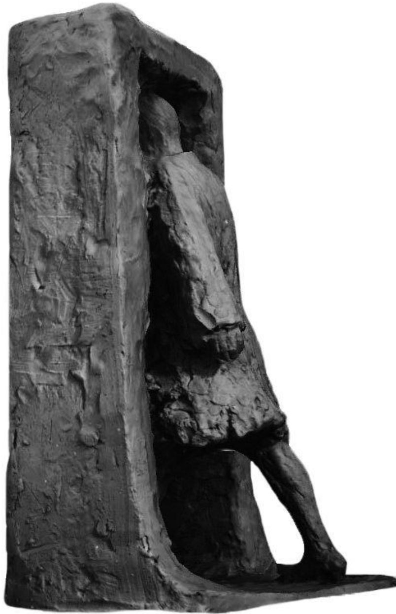
Slika 5. Bocceto „Kapar“, stražnja strana.