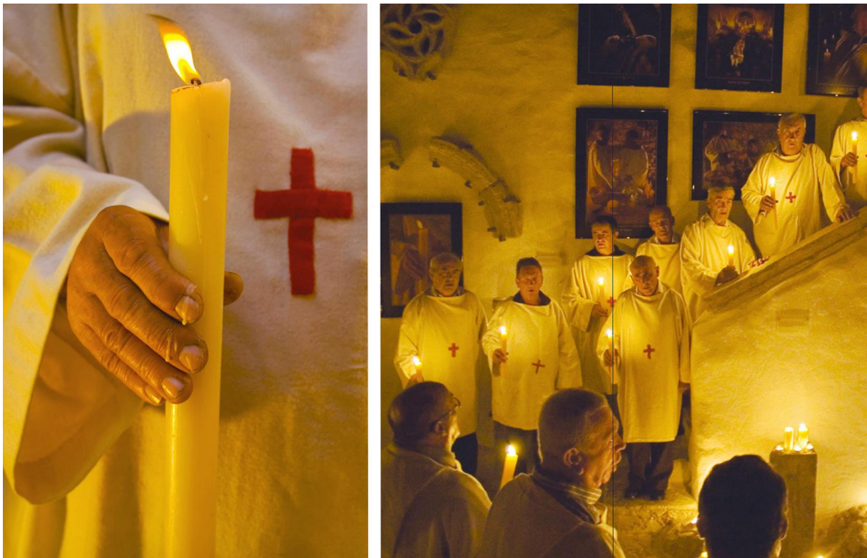
Slika 2. Kapari