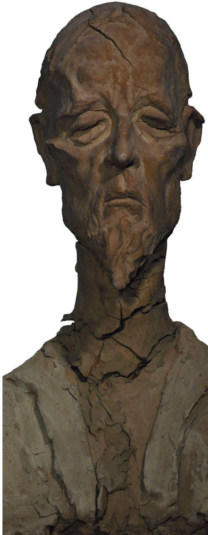
Slika 10. Skulptura „Don Quixote”.