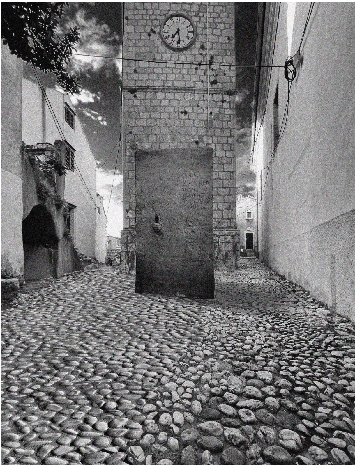
Slika 8. Fotomontaža „Kapar” u prostoru.