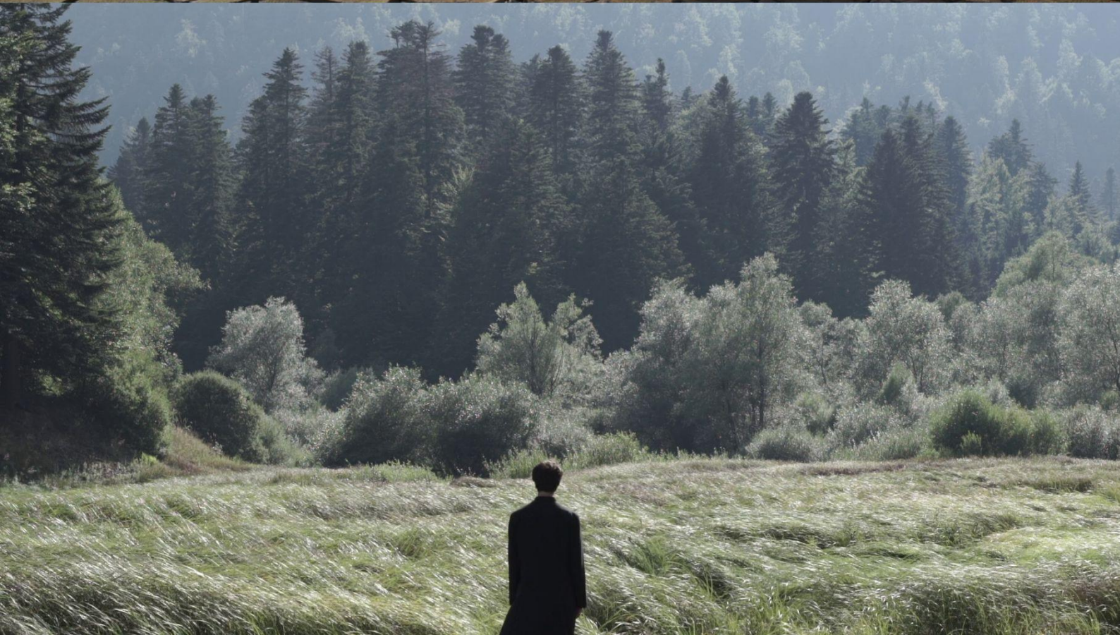
Slika 17. i 18. Kadrovi iz filma „Braća Karamazovi; Knjiga VI”.