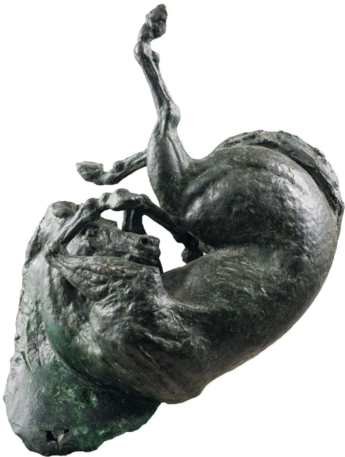
Slika 14. Skulptura „Konj"