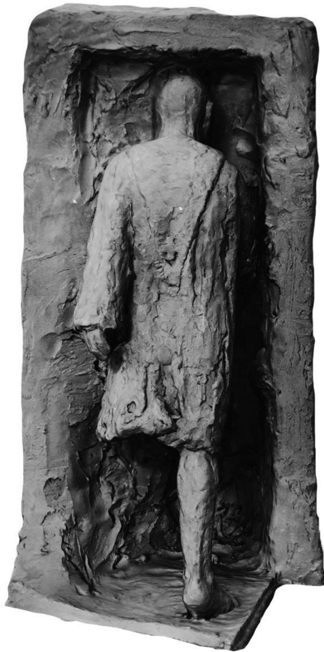
Slika 6. Boceto „Kapar”, stražnja strana.