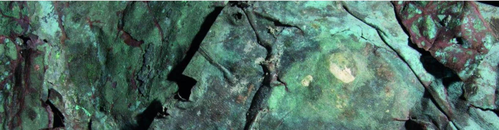
Slika 11. Skulptura „Kuja”, detalj.

Figura umorne i životom pretučene kuje prelazi u fatamorganu postojanja i naslućuje uvid u onostranost i nevidljivu zbilju u svjetlosti koja prolazi kroz pukotine skulpture.