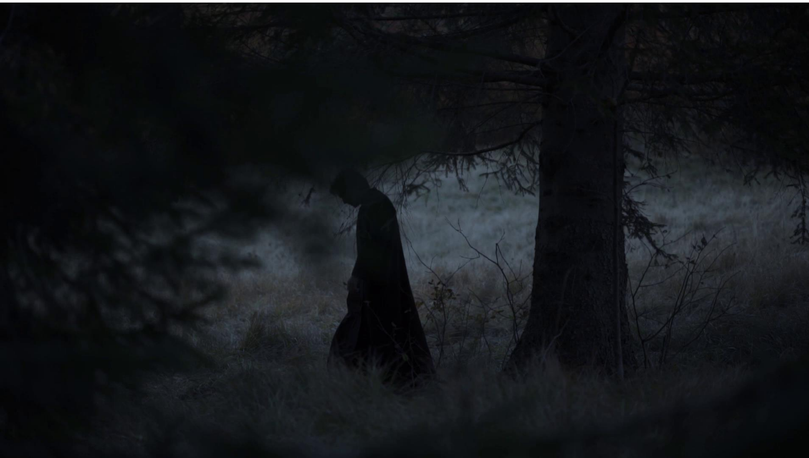
Slika 19. Kadar iz filma „Braća Karamazovi; Knjiga VI”.