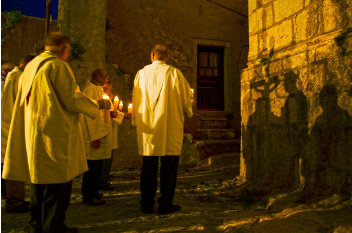
Slika 1. Procesija kapara