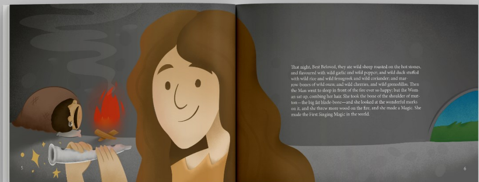
Slika 3. Mockup slikovnice, stranice 5-6