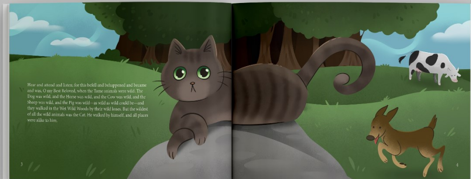
Slika 2. Mockup slikovnice, stranice 3-4