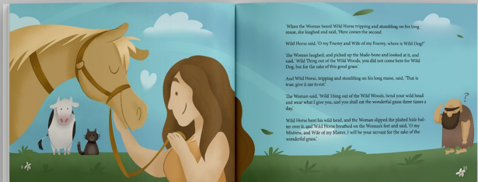
Slika 4. Mockup slikovnice, stranice 9-10