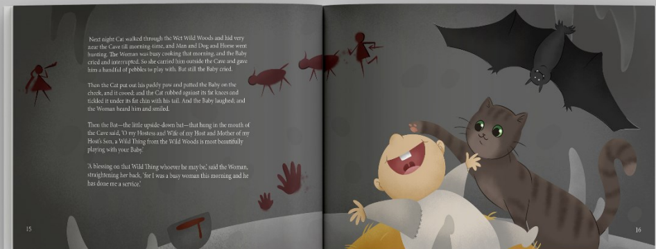
Slika 5. Mockup slikovnice, stranice 15-16