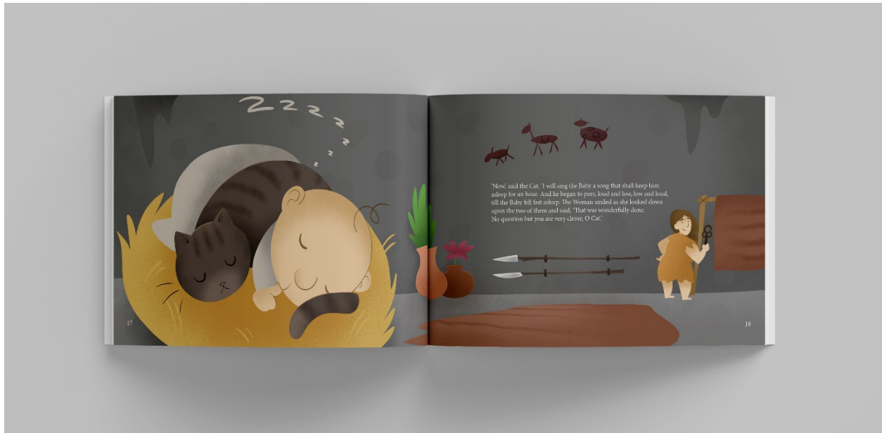
Slika 6. Mockup slikovnice, stranice 17-18