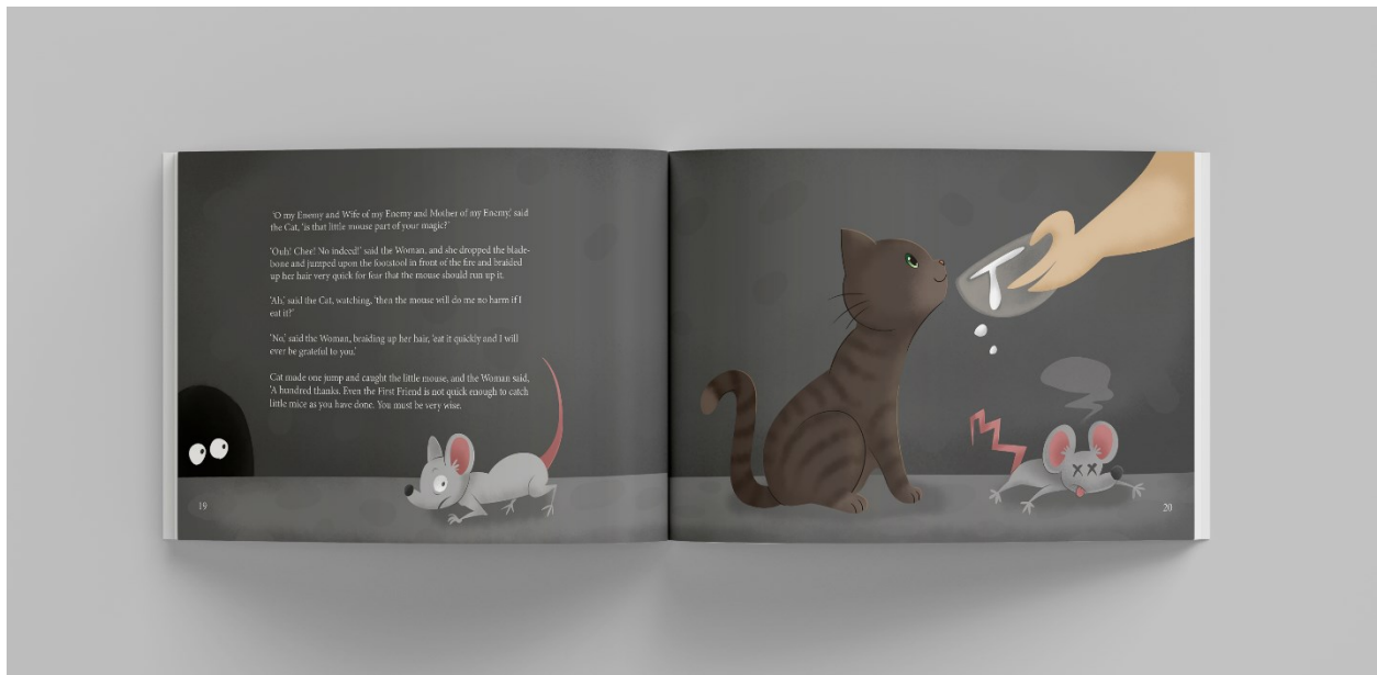
Slika 7. Mockup slikovnice, stranice 19-20