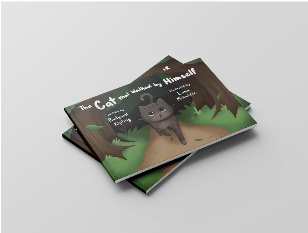
Slika 1. Mockup naslovnice

Odabrala sam ovu priču jer Kiplingovo pisanje smatram privlačnijim od mnogih klasičnih bajki. Vjerujem da bih, da sam ovu priču čitala kao dijete, također doživjela lik mačke ili žene mnogo simpatičnijima i srodnijima od protagonista drugih klasika. To je zahvaljujući Kiplingovom duhovitom stilu pisanja i šarmantnoj karakterizaciji likova. Zbog toga mi je primarni cilj u izradi završnog rada bio, kroz svoje ilustracije, prenijeti taj šarm i humor izvornog teksta.