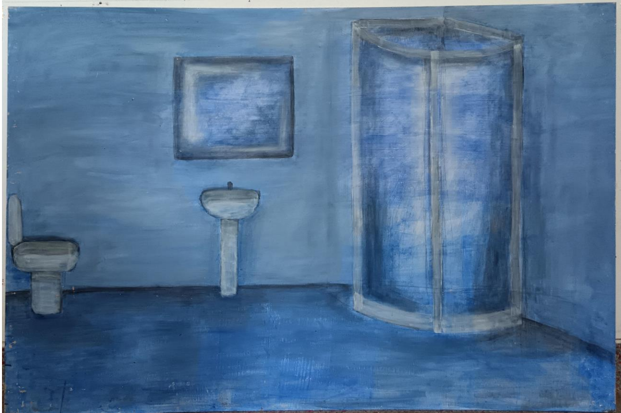
16, akril na medijapanu, 101.5 x 69, 2024