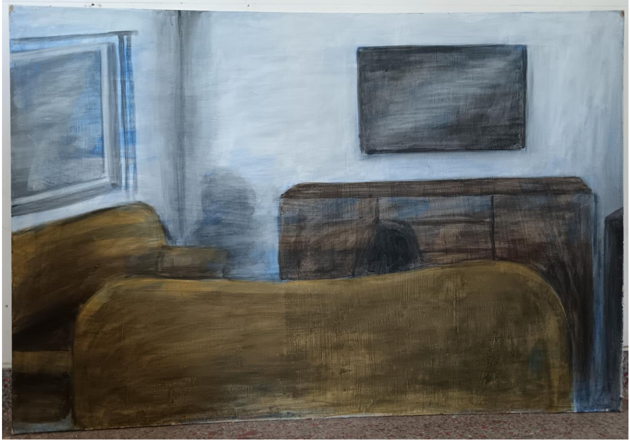
17, akril na medijapanu, 101.5 x 69, 2024