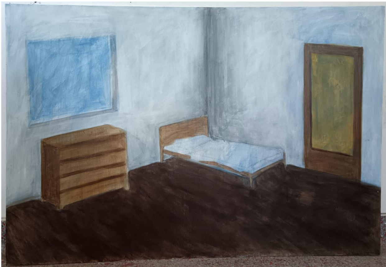
4, akril na medijapanu, 101.5 x 69, 2024