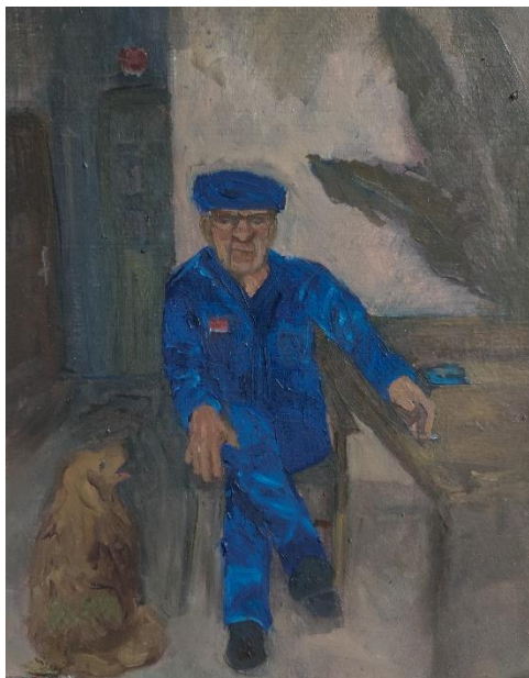
Brajković, L_ Sjećanja_#6 Barba Nini i Bobi, 24 x 30 cm, ulje na medijapan ploči, 2024.