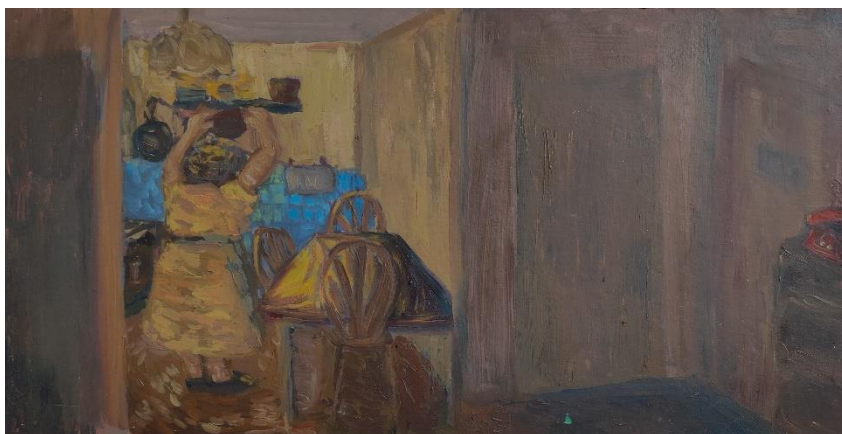
Brajković, L_ Sjećanja_#2 Teta Marta, 28 x 50cm, ulje na medijapan ploči, 2024