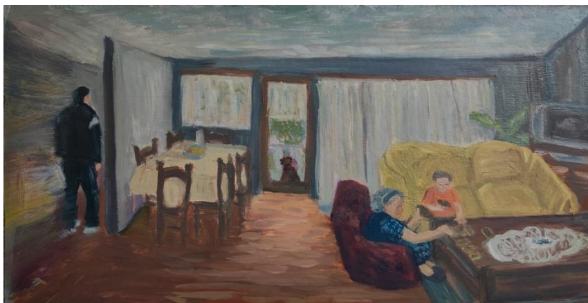
Brajković, L_ Sjećanja_#1 Opet si pobedio ,28x 50 cm, ulje na medijapan ploči, 2024.