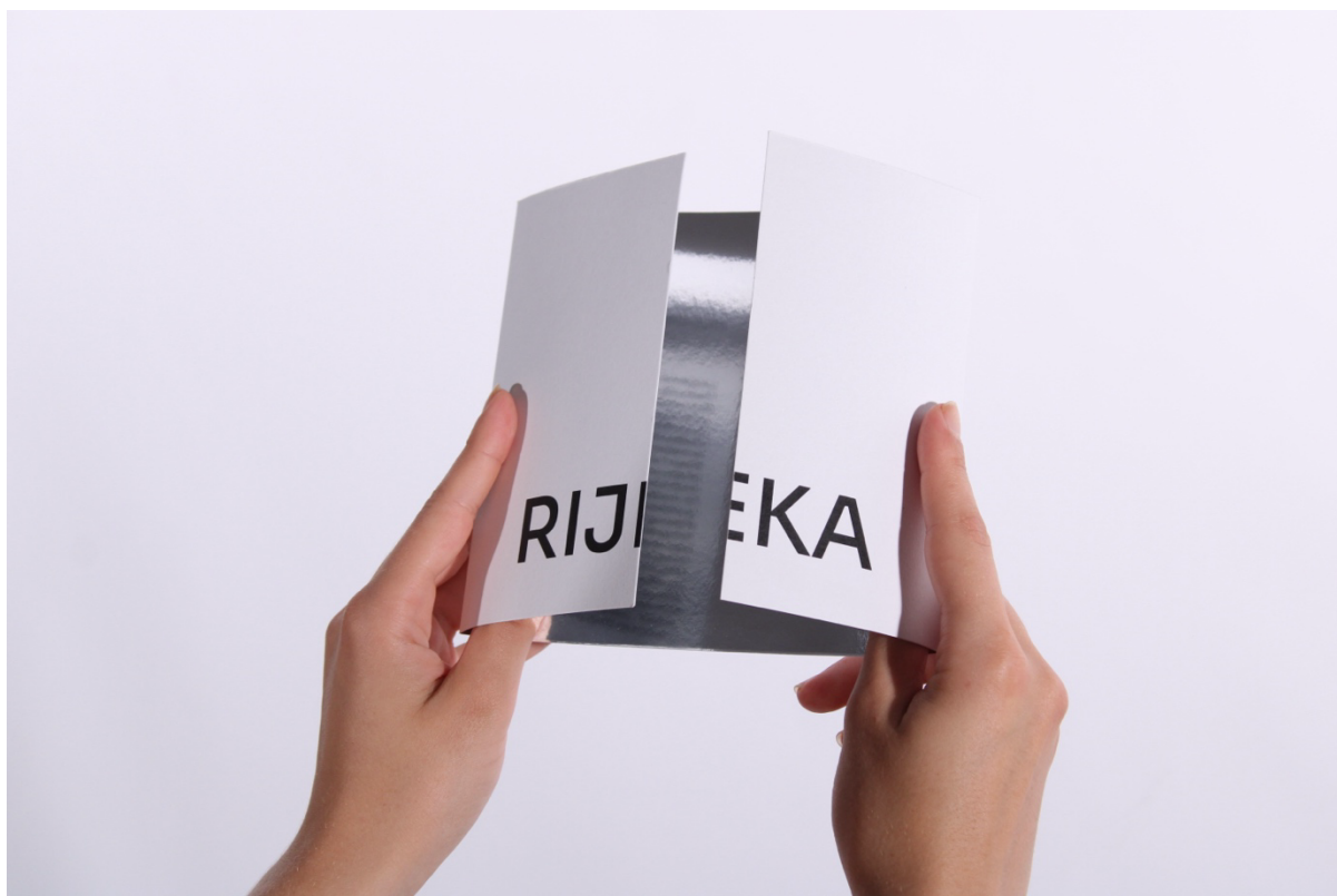
Slika 3 - Prikaz prednje strane zatvorenog deplijana