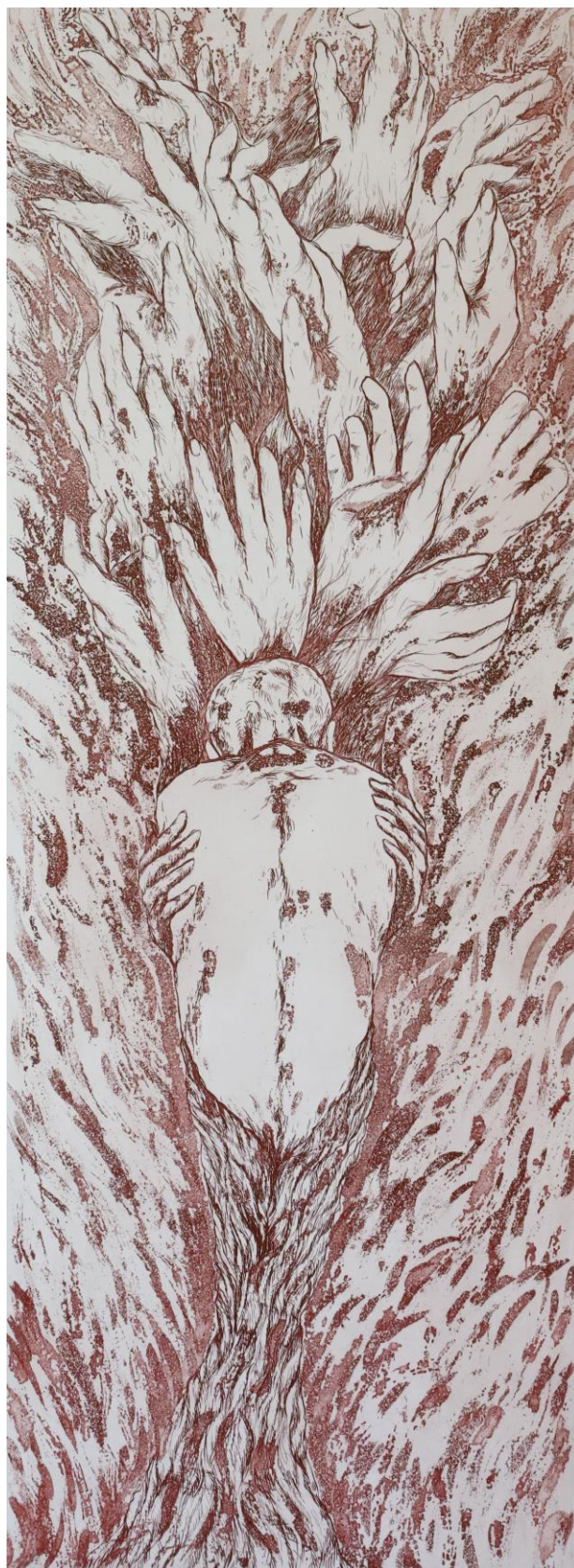
Slika 23. Završni otisak u crvenoj boji, „Zagrljaj“, 70 x 25 cm, kombinirana tehnika, Petra Arežina, 2023.