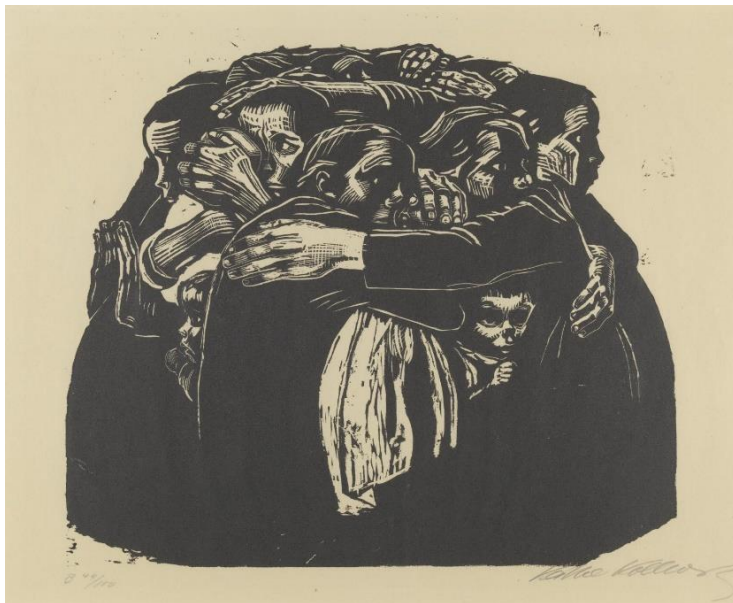
Slika 11. Lijevo: Käthe Kollwitz, The Widow I, 1921./Slika 12. Desno: Käthe Kollwitz, The Mothers, 1921./2.