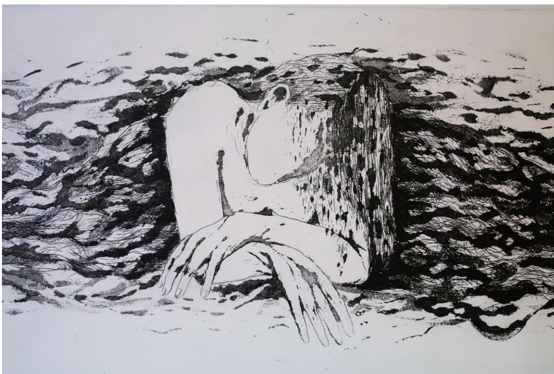
Slika 28. Detalj iz grafičkog lista „Nepovredivo mjesto“, kombinirana tehnika, Petra Arežina, 2023.