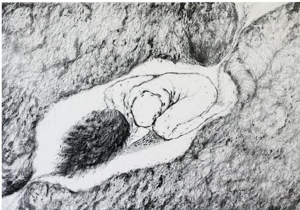
Slika 19. Završni otisak, „Utočište 2“, 50 x 70 cm, kombinirana tehnika, Petra Arežina, 2023.