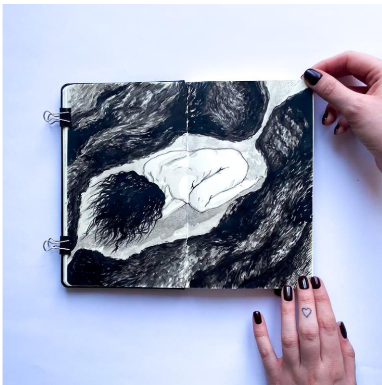
Slika 17. Skica iz sketchbooka, kombinirana tehnika, Petra Arežina, 2023.

Prvi autoportret na pravokutnom otisku okrenut je leđima te je smješten u samom centru, a u samoj dužini obavijen je tankim linijama. Figura prekriva svoje lice rukama istežući se kao da se budi iz sna te se stapa s prostorom. Stijenke tog prostora naznačavam ekspresivnim linijama čiji potezi naglašavaju njihovu dinamičnost. Raspon tonova u grafičkoj tehnici stvaram kroz gustu slojevitost linija i njihovu samostalnost. Figura na drugome radu prikazana je u zgrčenom položaju, te joj je lice okrenuto prema tlu i prekriveno kosom. Smještena je u šupljini koju štiti ambijent izgrađen od gustih, tamnih stijenki, već spomenutog organskog prostora. Ta se šupljina sužava prema izlazu iz formata te kroz nju gradim kratkim, ostrim linijama tijekom kojih daje tek naznaku da se do nje može doprijeti izvana. Organski elementni prostora se zgušnjavaju oko šupljine u kojoj je smještena figura te joj time daju na osjećaju zaštite.