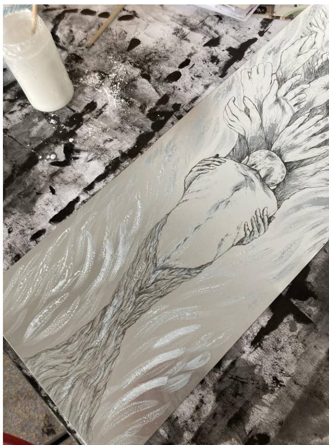
Slika 15. Postupak nanošenja smjese za reservage

U izradi diplomskog rada koristim grafičku tehniku bakropis i reservage . Nizanjem bakropisnih linija ostvarujem napetost i mekoću samih figura i organskog prostora. Završne matrice na kojima sam zadovoljno dočarala raspon linija jetkala sam po desetak minuta. Tehniku reservagea koristila sam upravo kako bih što vjernije dočarala poteze rađene laviranim tušem u crtežu. Reservage mi je pružao tu spontanost te sam tako uz bakropisne linije nadopunila i pojačala raspon debljih linija koje su mi u konačnosti produbile vizualni ali i idejni element diplomskog rada.