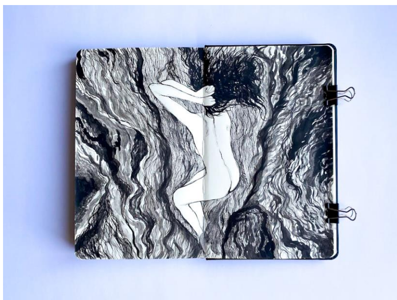
Slika 16. Skica iz sketchbooka, kombinirana tehnika, Petra Arežina, 2023.

U ovom odlomku pojasnit ću način rada pravokutnih grafičkih otisaka pod nazivima „Utočište 1 i 2“. Crteži iz sketchbooka poslužili su mi kao inspiracija za izradu pravokutnih dviju grafika. Oba su crteža nastala spontano bilježenjem toka misli u sketchbooku . Sketchbook se definira kao blok s praznim stranicama za skiciranje. Umjetnici ga često koriste za crtanje ili slikanje kao dio svog kreativnog procesa. Neki ga koriste za skiciranje nacрта za buduća umjetnička djela. 45 Na taj sam ih način i ja koristila. Pri izradi crteža koristila sam lavirani tuš i rapidograf, kojima sam nizala tanke linije kako bih sagradila snop nastao od crnih poteza kistom. Kroz autoportret pozicioniram lik unutar zamišljenog prostora gdje gradim svoje sigurno utočište. Prvu sam matricu obradila izričito samo u bakropisu, dok sam na drugoj nadodala tanke slojeve reservagea kako bih zagustila prostornu vrijednost. Linije bakropisa od kojih je satkana šupljina u kojoj se figura nalazi bile su fine i tanke, dok je vanjski prostor načinjen od tamnijih, debljih linija jačeg intenziteta. Obrisnu liniju figure gradila sam debljim linijama, a tanjim isprekidanim sam na nju dodavala detalje. Kosa je satkana od gustih tankih linija koje su u kontrastu sa samom figurom, radi ekspresivnog nizanja, odnosno graviranja.