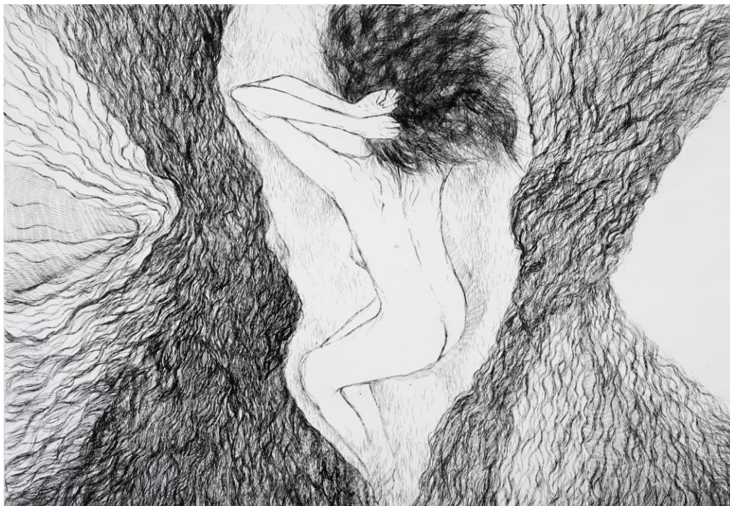
Slika 18. Završni otisak, „Utočište 1“, 50 x 70 cm, bakropis, Petra Arežina, 2023.