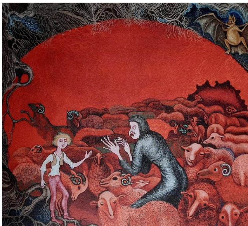
Slika 6. Ilustracija za priču "Jagor" Ivane Brlić Mažuranić, 1970.

Proučavajući razne umjetnice u crtačkom mediju pozvala bih se na djela Cvijete Job. Slikarica i ilustratorica minijatura Cvijeta Job rođena 6. kolovoza 1924., a umrla je 18. lipnja 2013. godine. Bavila se slikanjem minijatura koje su je nadahnjivale, a posebice onima srednjovjekovne rane renesanse. Najveći ilustratorski opus Cvijete Job bile su pripovijetke Ivane Brlić Mažuranić. U svojim minijaturama često koristi elemente nadrealizma. 37 Hrvatskoj je javnosti najpoznatija po ilustracijama dječjih knjiga kao što su Puškinove i Andersenove bajke, slikovnice prema pričama Ivane Brlić-Mažuranić, poznatu bajku Petra P. Jeršova „Konjić Grbonjić“, „Lovačke zapise“ Ivana Sergejeviča Turgenjeva i djela Petra Šegedina. 38