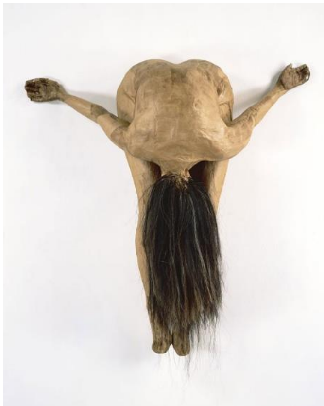
Slika 7. Kiki Smith, Untitled , 1995.

Umjetnica Kiki Smith rođena je 18. siječnja 1954. godine u Njemačkoj. U svojim radovima istražuje životne misterije kao što su duhovnost i smrt, a motiv koji se često pojavljuje u njenim skulpturama, grafikama i crtežima je ljudsko, posebice žensko tijelo koje prikazuje kroz razne faze života, ali i smrti. 39 Bavi se prikazom djelova ljudskog tijela i žena prikazanih na različite načine; gole, raskomadane, hibridne itd. Sam način izvedbe i mediji koje koristi u svojim radovima vrlo su različiti od onih svojstvenih mojim radovima koji su uglavnom crteži i grafike, no smatram da je ono što ih povezuje sličan izbor motiva. Obje kao motiv najčešće biramo žensko tijelo koje prikazujemo i oblikujemo na neobične načine te koje služi kao narator određene individualne priče.