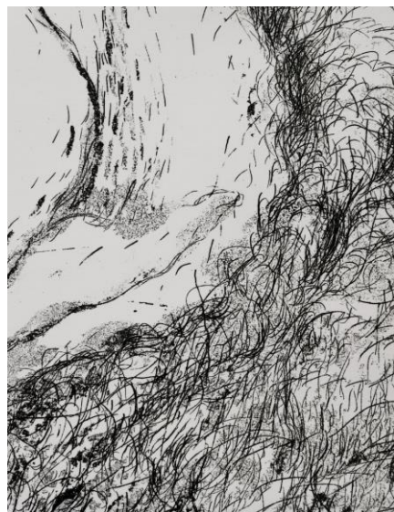
Slika 21. Lijevo: Detalj iz grafičkog lista „Utočište 2“, kombinirana tehnika, Petra Arežina, 2023./Slika 22. Desno: Detalj iz grafičkog lista „Utočište 2“, kombinirana tehnika, Petra Arežina, 2023.