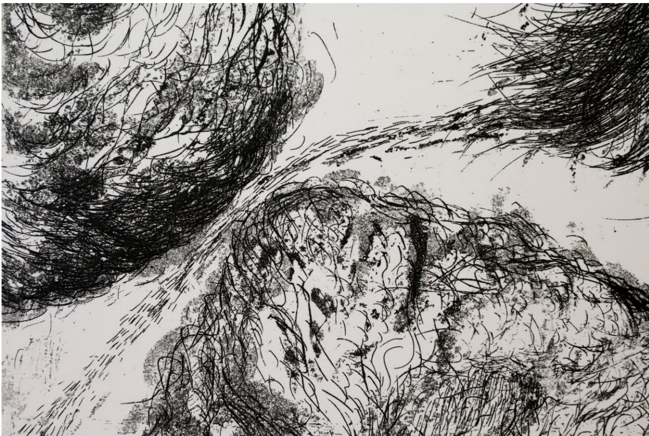
Slika 20. Detalj iz grafičkog lista „Utočište 2“, kombinirana tehnika, Petra Arežina, 2023.