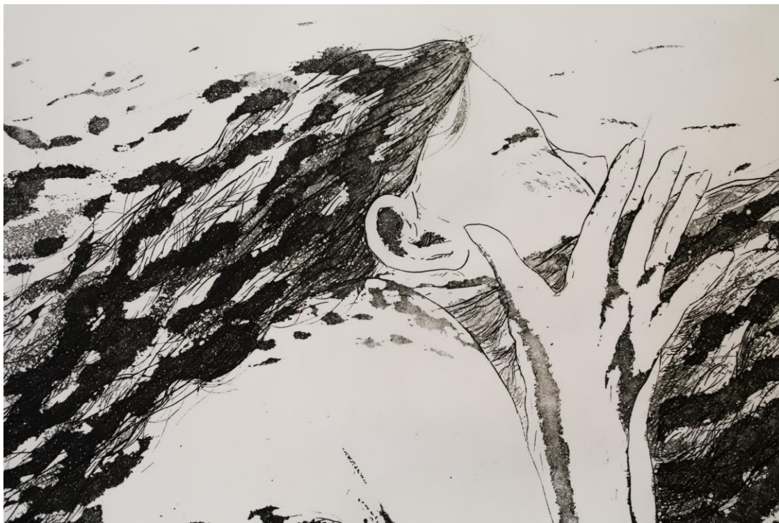
Slika 27. Detalj iz grafičkog lista „Nepovredivo mjesto“, kombinirana tehnika, Petra Arežina, 2023.