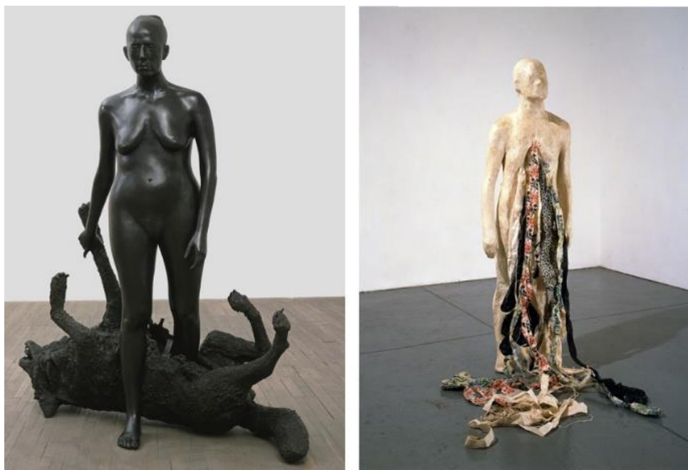
Slika 8. Lijevo: Kiki Smith, Rapture , 2001./ Slika 9. Desno: Kiki Smith, Untitled , 1992.

U svojim radovima prikazuje degenerativnu prirodu tijela te oni izazivaju morbidnu znatiželju o smrti i propadanju. Poveznica i inspiracija koju pronalazim u njenim radovima leži u fascinaciji anatomijom, ženskim tijelom, ali i u prikazivanju unutarnjeg svijeta i mističnih elemenata kroz prikaz ljudske figure koja je ponekad pasivni objekt mučenja i zlostavljanja, ali može se i regenerirati i doživjeti ponovno rođenje. 40