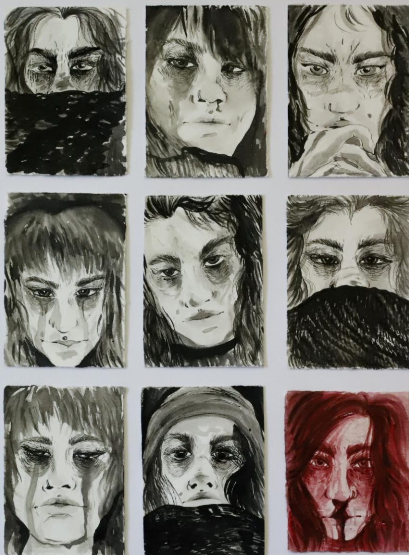
Slika 4. Serija crteža „Bez naziva“, 30 x 24 cm, kombinirana tehnika, Petra Arežina, 2023.