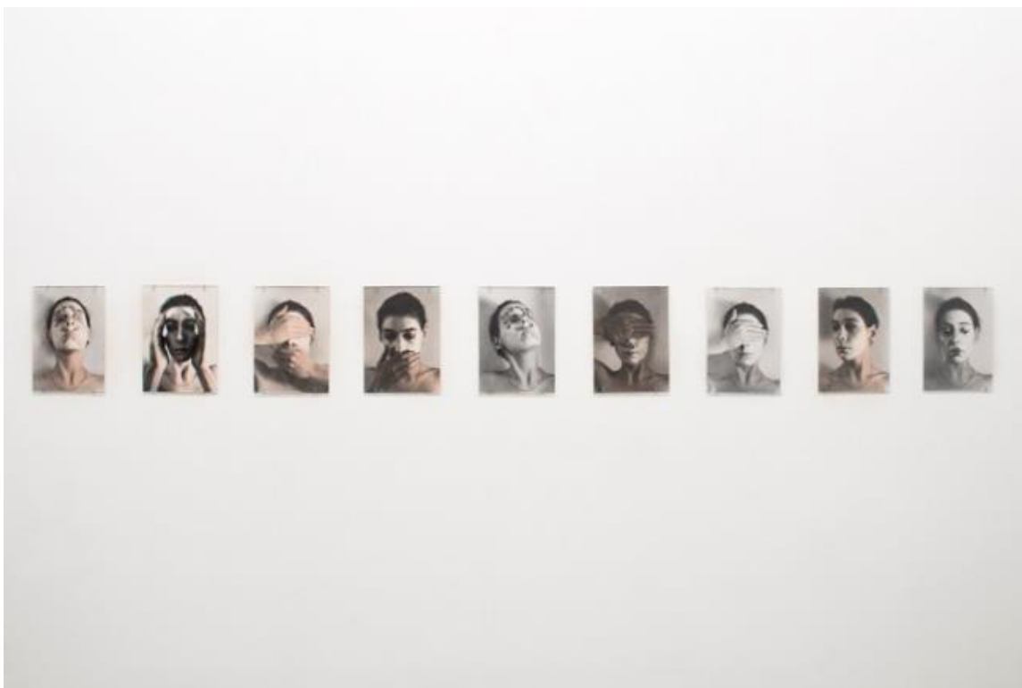
Slika 13. Janice Guy, Untitled, 1976.

Janice Guy je umjetnica je i galeristica rođena 29. siječnja 1953. godine u Velikoj Britaniji. Bavi se fotografijom te fotografira uglavnom autoportrete. Često odabire samu sebe kao subjekt vlastitog umjetničkog rada. Fotografira vlastiti lik u okolnostima koje sama izabire te na taj način preuzima kontrolu nad vlastitim tijelom. Kroz svoje autoportrete prenosi vlastite osjećaje i misaona stanja te oni nastaju ne samo za promatrača, nego primarno za samu umjetnicu. Njen cilj je prikaz vlastitog mikrosvijeta kroz medij fotografije 43 , s čime se lako mogu poistovjetiti jer je to često i moj cilj pri izradi umjetničkih radova.