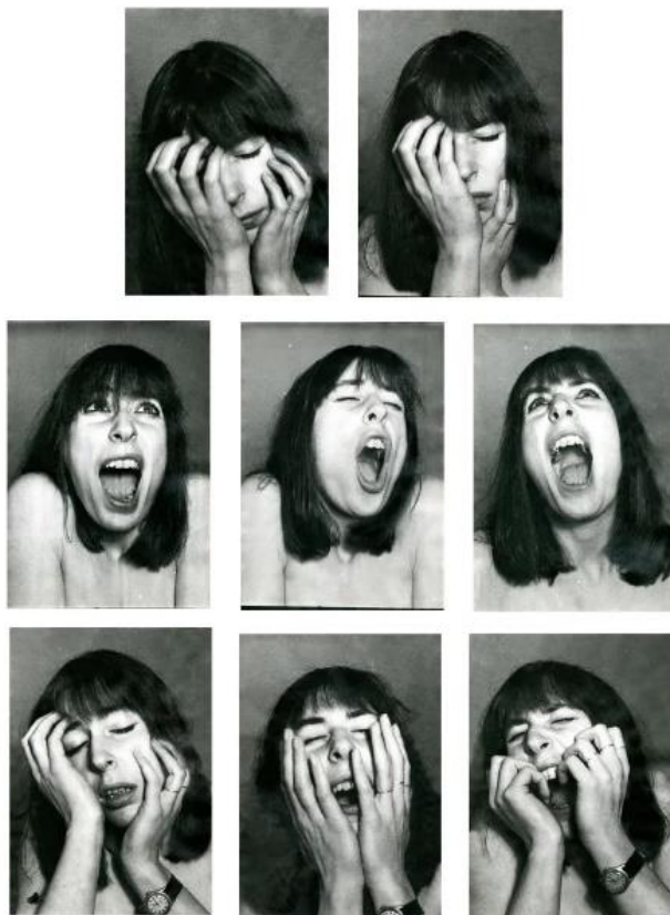
Slika 14. Janice Guy, Untitled, 1977.

Poveznicu između mog rada i rada umjetnice pronalazim u činjenici da obje kroz sebi svojstven medij istražujemo vlastiti lik te kako on izgleda dok prolazi kroz razna psihička stanja.