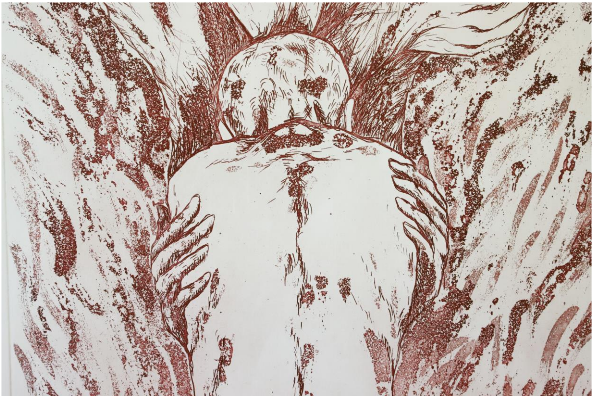
Slika 3. Detalj iz grafičkog lista „Zagrljaj“, kombinirana tehnika, Petra Arežina, 2023.

Ideju za svoje stvaralaštvo pronalazim u svom osobnom životu. Svojim radovima ilustriram vlastite emocije, međuljudske odnose, pojedinosti koje zapažam u vlastitoj svakodnevnici, a koje imaju utjecaj na moju svijest. Ideja za rad nameće se sama kao odgovor na životnu situaciju u kojoj se nalazim. Kroz crtež i grafiku bavim se prikazom i razrješenjem vlastitih emocija te gradim imaginarne likove i prostore.