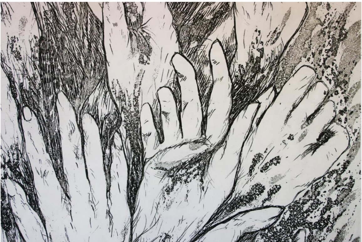
Slika 25. Detalj iz grafičkog lista „Zagrljaj“, kombinirana tehnika, Petra Arežina, 2023.