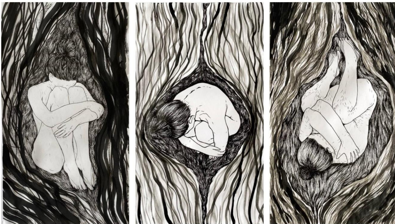
Slika 5. „Bijeg“, 30 x 42 cm, kombinirana tehnika, Petra Arežina, 2023.

Sljedeća serija radova od tri crteža pod nazivom „Bijeg“ vizualno opisuje figuru unutar imaginarne ovojnice. Zajedno čine triptih u kojem se nadopunjuju te crtež spojeni jedan uz drugi dobivamo osjećaj da se figure okreću u svom prostoru. Kroz seriju radova izvedenih u crtežu tragam za sigurnom prostornom sferom – utočištem. Prikazujem odrasle ženske likove u položaju nerođenog djeteta. Upravo tim položajem dajem naslutiti nesigurnost koju osjećam u tom trenutku. Oko sebe gradim ovojnici načinjenu od tankih stijenki koje postaju moj štit od vanjskog svijeta. U tom izgrađenom imaginarnom prostoru pronalazim svoje sigurno mjesto. Koristim raspon tonova od bijele do crne boje kako bi prostor poprimio privid volumena. Kroz takav crtež stvaram sama svoje utočište u koje smještam vlastiti lik koji u njemu nesmetano postoji i skriva svoju nesigurnost od vanjskog svijeta. Višestruki slojevi gradijenata i lavira koji ga okružuju sprječavaju da mu se išta približi i da bude dodirnut. U potrazi za svojim sigurnim mjestom bivam potaknuta da kroz crtež pronalazim svoje sigurno mjesto, čiji proces postaje meditativan. Postupkom crtanja i izrade grafika istovremeno pronalazim mir i sigurnost.