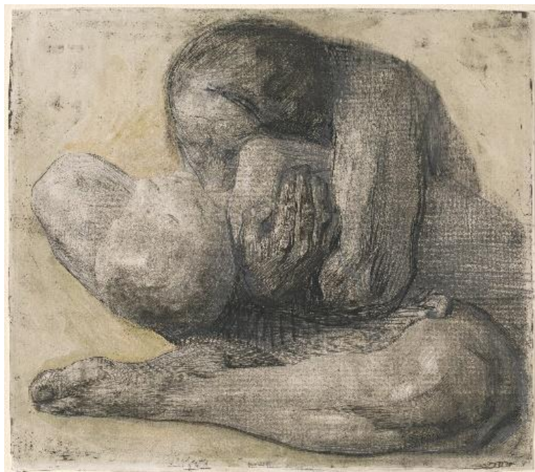
Slika 10. Käthe Kollwitz, Woman with a dead child, 1903.

Poveznicu s njenim pomalo mračnim grafikama pronašla sam ne samo u likovnom izrazu već i priči koja se nalazi iza njenih grafika. One su često bile inspirirane gubitkom članova obitelji s čime sam se mogla direktno poistovjetiti. Konkretno, gubitak njenog sina doveo je do umjetničinog životnog istraživanja teme žalosti. 42