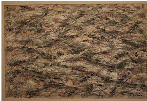
Oton Gliha: „Gromače“, nepoznato vrijeme 16

U Hrvatskoj, jedan od najpoznatijih primjera pejzažnog poluapstraktnog slikarstva ostavio je Oton Gliha s kojim također mogu napraviti poveznicu sa svojim radom. 1945. Slikao je krajolike nove hramonije sa skladom odnosa i boja, te slobodno izveo površinu i prostor u figuralnim kompozicijama naginjući prema apstrakciji. 1954. Započeo je proces sažimanja likovnih elemenata, u tom razdoblju nastaje slika „Primorje“, koja je bila prvo djelo iz ciklusa „Gromače“, koji se jako približio informelističkom shvaćanju površine. U likovnu materiju prenosi ritam gromača i sugerira svoj doživljaj krajolika. Prostor se svodi na plogu i crtež postaje samostalni element, a osnovni plastički elementi srodni su kaligrafiji glagoljice. Nakon 1963. Nastaju djela treptava ritma, koja postaju iluzija svjetlosnog i prostornog, tijekom 70-ih ističe kromatski ritam, a u iduća dva desetljeća snagom boje stvara svijetlost i prostor. 15