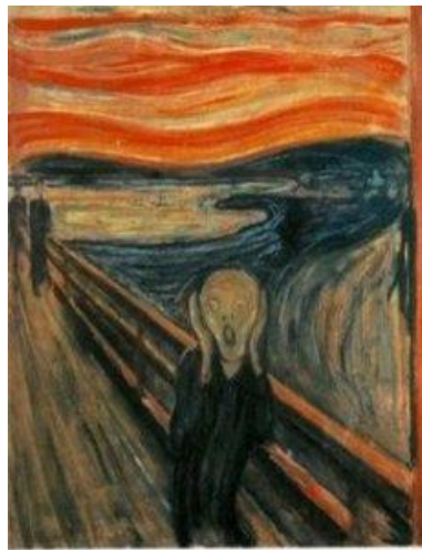
Edvard Munch, „Krik“, 1893. 2

Ekspressionizam je umjetnički pravac moderne umjetnosti koji se razvio početkom 20. stoljeća u Njemačkoj, prvobitno u poeziji i slikarstvu. Naziv potječe od francuske riječi ekspresio što bi značilo izražaj. Tada je norveški slikar Edvard Munch napravio prekretnicu u umjetnosti primjenjujući elemente ekspresionizma. Njegova djela „Strah“ i „Krik“ prvi su primjeri pesimističke ekspresije unutarnjeg zbivanja ljudskog stanja koje je jedno od glavnih elemenata ekspresionizma. Djelo „Strah“ koji je nastao deset godina kasnije od djela „Krik“ bila je njegova crno-bijela verzija, uz obrazloženje kako jedino bezbojnost može prenjeti pravo značenje slike. Prekretnica i glavni cilj ekspresionizma, za razliku od impresionizma koji se javio prije njega bio je poticanje subjektivnih unutarnjih emocija, stanja i misli autora te njegovo viđenje svijeta. Kroz povijest su te misli bile većinski izražavane pesimistično i katastrofično pod utjecajem straha, ratova i umiranja. Slika „Krik“ je također bitna za to razdoblje zato što se ekspresionizam naziva i „prvim krikom modernog čovjeka“. Danas taj izazov „ekspresivno“ koristimo za svaki umjetnički rad u kojem je stvarnost pomaknuta ili simbolički predstavljena kako bi opisala unutarnje stanje umjetnika, pod tom pojmom razvio se pravac neoekspresionizam. 1