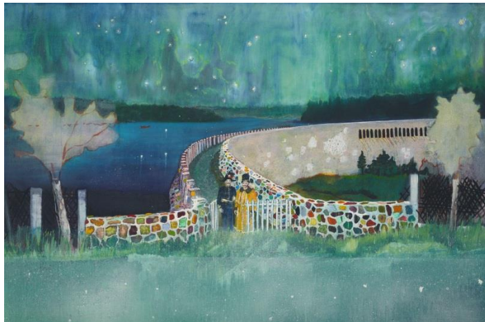
Peter Doig, „The Japan Times“, 2000. 8

jednog od umjetnika koji su aktualni i danas sa kojim se mogu referirati na svoj rad izdvojila bih škotskog slikara Petera Doiga koji bi pripadao pravcu magičnog realizma i neoekspresionizma. Njegove slike u većini slučajeva sadrže ljudske figure koje mogu biti skrivene i zaklonjene od okoline. Odbacuje rascjep između figuracije i apstrakcije te koristi tehnike apstraktnog slikarstva poput točaka i mrlja da bi sugestirao ili reprezentirao doživljaj- kao u snježnim pejzažima. Boju koristi ekspresivno, kaotično i učinkovito. Paleta su mu prilagođene tako da stvaraju balans kompozicije bojom, mogu biti prigušene, hladne, tople ili svijetle. Komplementarne boje su u velikoj mjeri prisutne, poput sentimentalne pastelne, beskompromisne crvene i bolesno zelene, pokazujući odvažnost s bojom koja je jedinstvena njegovoj generaciji. Jedna od također interesantnih poveznica s njim je da kombinira slike iz više izvora, filmskih, književnih i umjetničkih, ali i reference vlastitih sjećanja, kako bi stvorio djelom realistične, djelom magične prizore u svojim djelima. 7