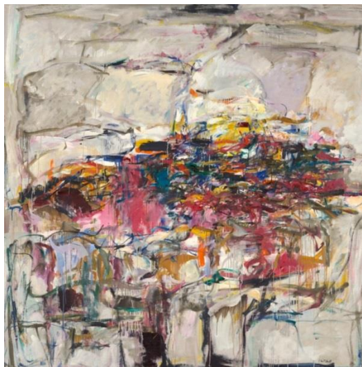
Joan Mitchell: „City Landscape“, 1955 5 .