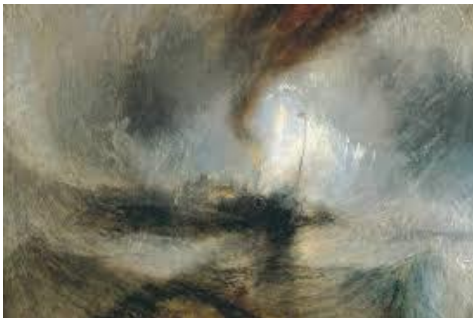
J.W.Turner: „Snježna oluja, 1842.” 13

je za vanjskim subjektivnim efektima, ignorirao je precizno izvođenje detalja i statičnih prizora za kojima us težili veliki majstori. Razvio je slikarske efekte kako bi prikazao percepcije promatrane prirode. Mnoge od tih tehnika oslikavanja za izazivanje osjećaja postat će tema slikara koji su se bavili apstraktnim ekspresionizmom. 12