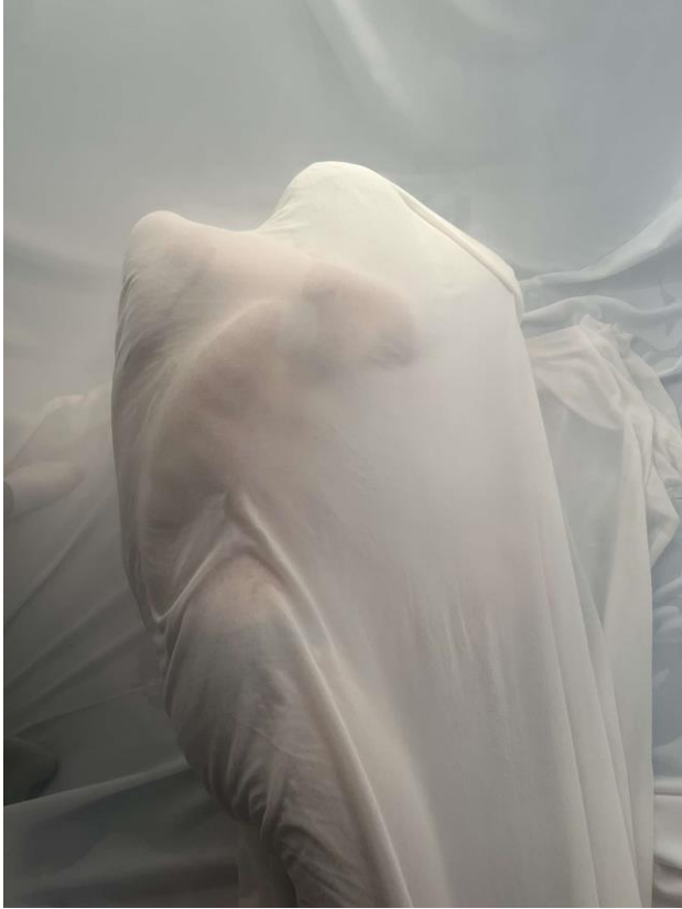
Drugi dan snimanja, Black box, film Puls, 2024.