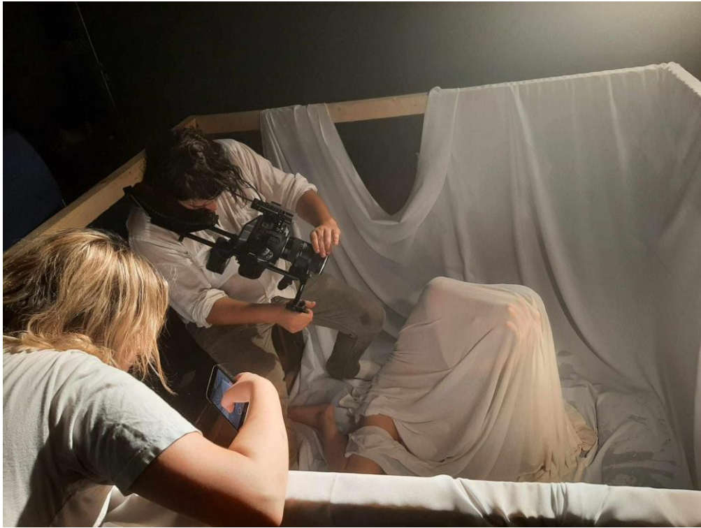
Drugi dan snimanja, Black box, film Puls, 2024.