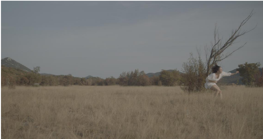
Kadar iz filma “Puls”, 2024.