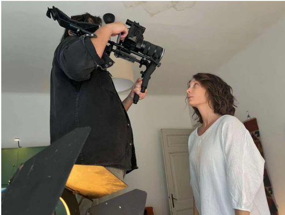
Prvi dan snimanja, stan u palači Ploeh, film Puls, 2024.