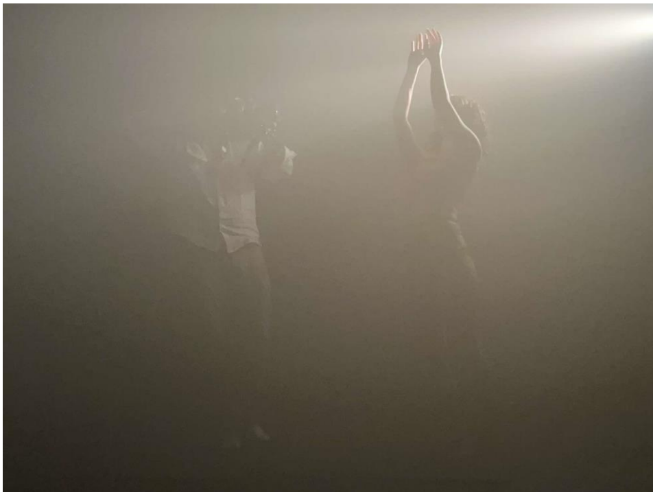
Drugi dan snimanja, Black box , film Puls, 2024.