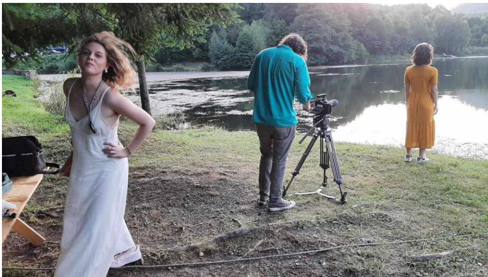
Treći dan snimanja Mrzle vodice, film Puls, 2024.