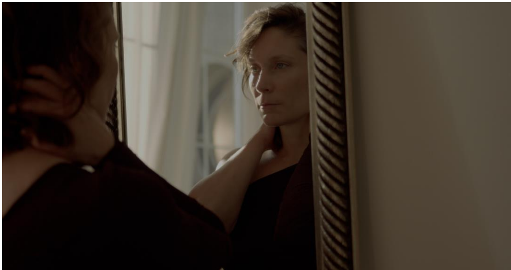
Kadar iz filma "Puls", 2024.