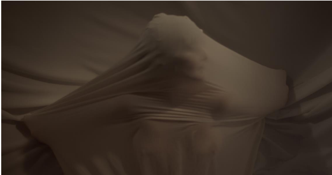
Kadar iz filma “Puls”, 2024.