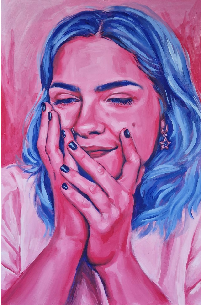
Jakubin Paula, "Zaljubljenost", 2024.

Osjećaj ljubavi i zaljubljenosti najčešće je asociran s ružičastom bojom. Glavna boja djela koju sam koristila je bila roza u kontrastu s plavom, koju smatram da je u smislu simboličke najljepša, te savršeno reprezentira sve ono što ljubav izvlači iz ljudi. Nju sam pozicionirala gdje su smješteni najtamniji tonovi portreta.