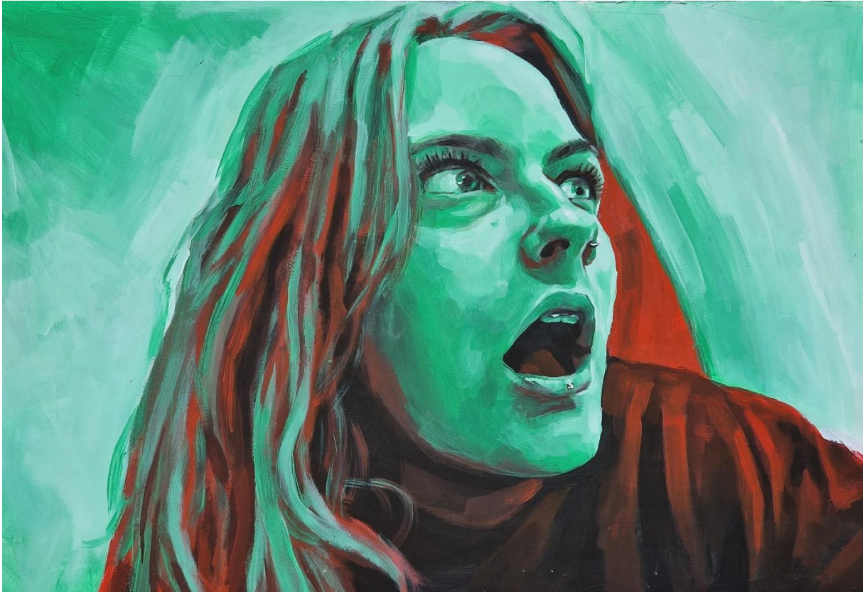
Jakubin Paula, "Oduševljenje", 2024.

Zadnja slika serije možda na prvu djeluje kao da zelena boja nije dobar odabir za predstavljanje emocije oduševljenje, no ovdje se radi o subjektivnoj asocijaciji. Zelena je boja prirode. Ona u meni budi osjećaj divljenja i koliko god puta se nađem u prirodi svaki put me iznova oduševi. Osim zelene koristila sam njen komplementarni par crvenu za sjene.