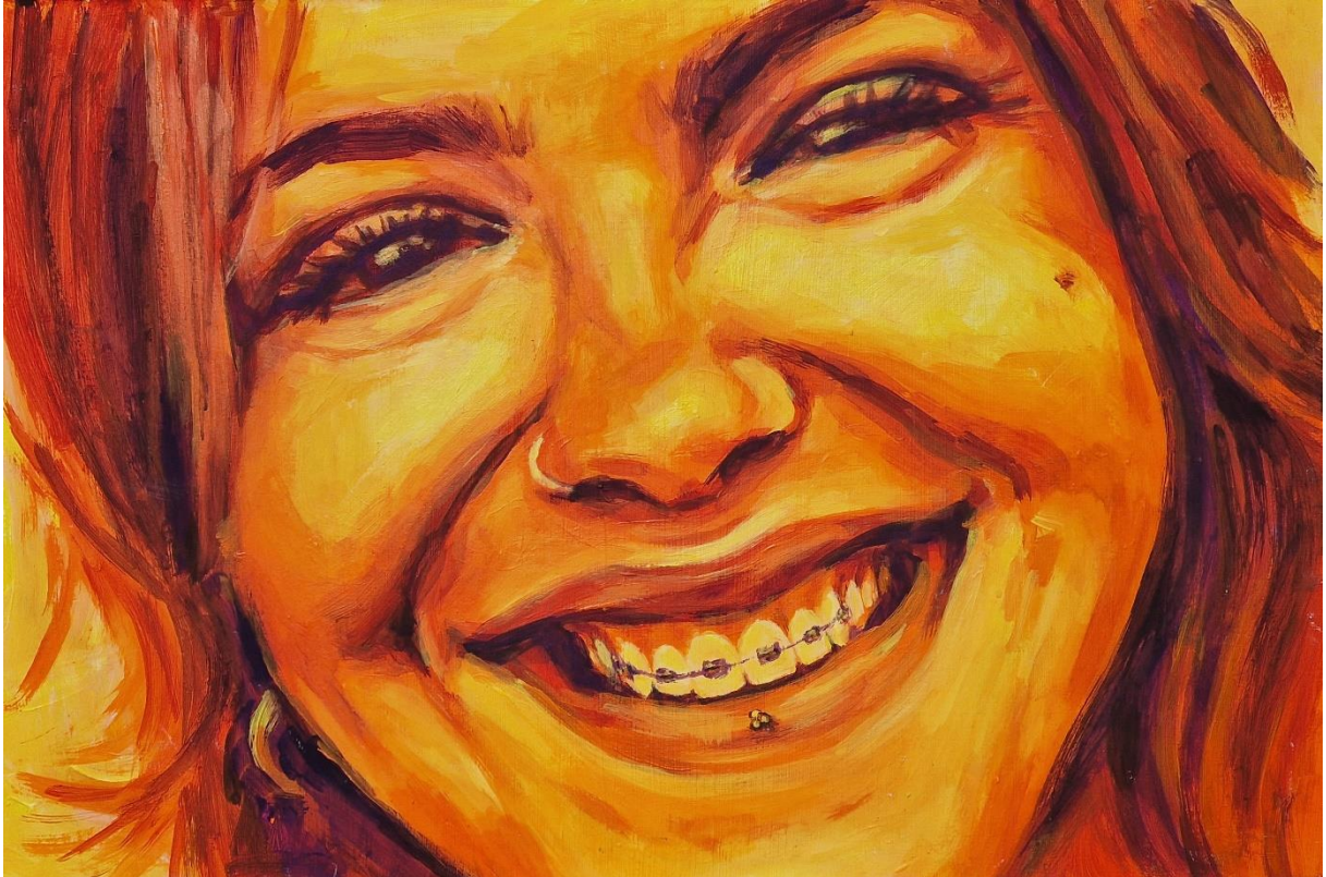
Jakubin Paula, "Sreća", 2024.

Prva emocija koju sam naslikala bila je sreća. Ovu emociju sam predstavila s velikim dječjim smiješkom. Osnovna boja slike je žuta jer me asocira na sunce i sve lijepe tople osjećaje. Za najsvjetlije tonove i pozadinu koristila sam žutu. Srednji tonovi su narančasti a sjene i najtamniji dijelovi portreta su u komplementarnom paru žute boje, ljubičastoj.