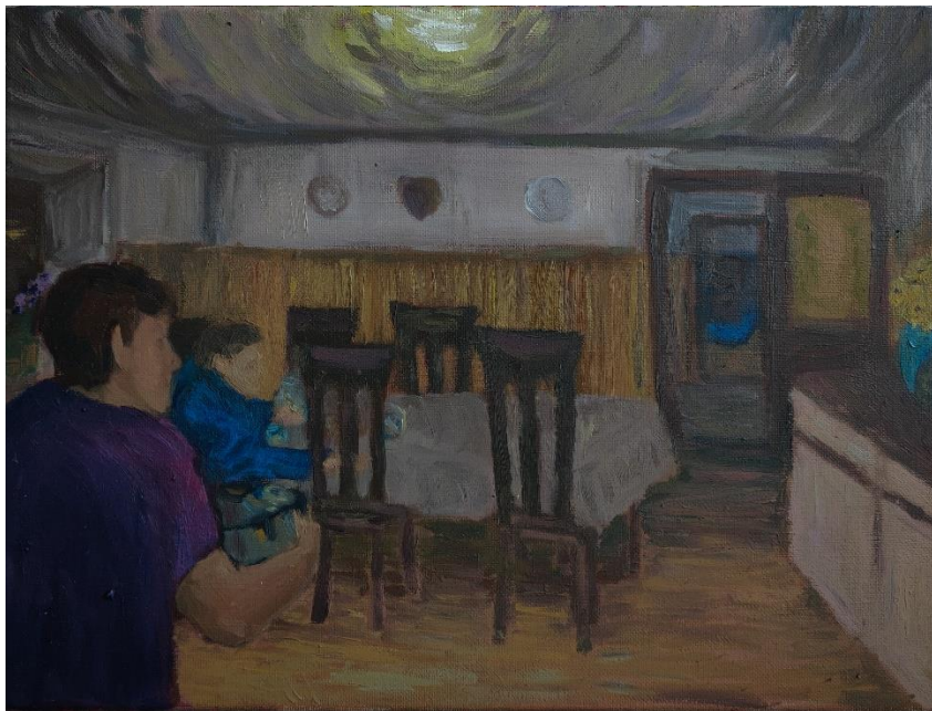
Brajković, L_ Sjećanja_#3 Poli none i noneta, 30 x 40 cm, ulje na medijapan ploči, 2024.