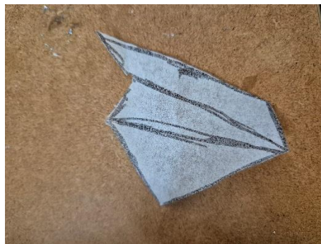
Slika br. 10, Gombar J., rezanje nožem 2024. Slika br. 11, Gombar J., paus šablone 2024.