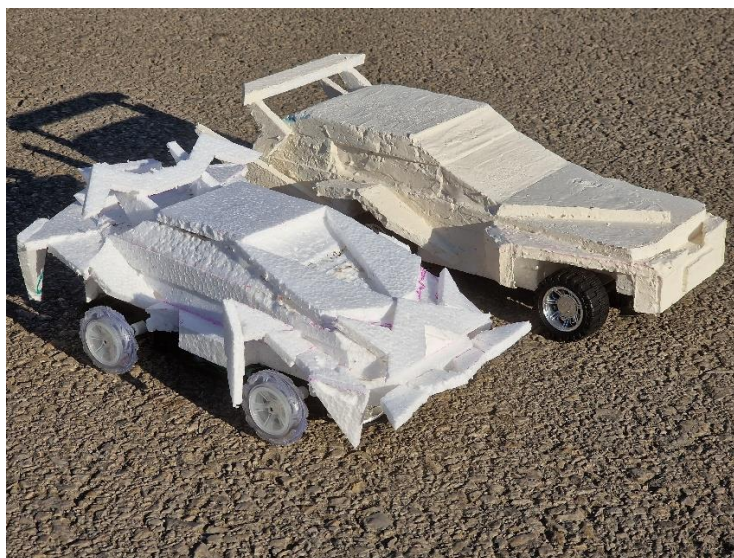
Slika br. 8, Gombar J., modeli za izradu svjetiljke, 2024.

U početku sam trebala razmisliti i odabrati kako će izgledati moje svjetiljke. Odlučila sam se za oblik auta zbog toga što mi je bila namjera spojiti nešto tradicionalno sa nečim modernim. Tako sam se odlučila za tradicionalni materijal koji je staklo i za moderan dizajn što je auto. Svoje ideje sam sastavila od stiropora u obliku idejnih rješenja odnosno kao neku skicu, model i kalup za predočenje za daljnji razvoj. Model u stiroporu sam radila od različitih debljina stiropora, žica i ljepila za stiropor kao materijal za spajanje. Za donji dio tj. stalak koristila sam plastičnu podlogu s gumama koje se mogu kretati naprijed i nazad. Time sam svjetiljki dodala još jednu funkciju te ju je to učinilo interaktivnom.