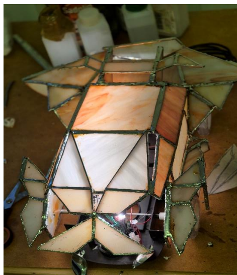
Slika br. 5. i 6. Gombar J., spajanje led svjetla i stakla, 2024.