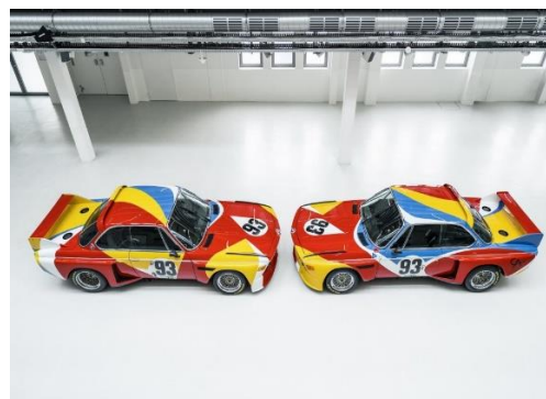
Slika br. 3., 4., Alexander S.C Cadler BMW Art Car, Neue National galerie, Berlin