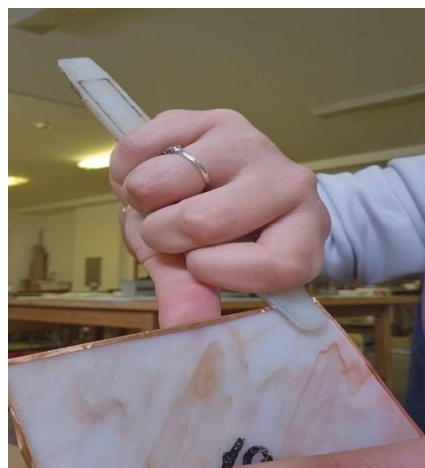
Slika br. 13, Gombar J., oblaganje, 2024.