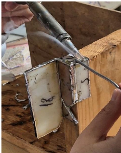
Slika br. 15, Gombar J., spajanje stakla lemom, 2024.

Nakon čišćenja i postavljanja bakrene folije, bakrenu foliju prolazimo sa teflonskom špahtlom da bi se bakrena folija izravnala i zalijepila što više za staklo. Nakon ravne podloge, dijelove koje želimo lemiti stavljamo jedan kraj drugoga i uzimamo kositar u žici koji već u sebi ima pastu za lemljenje te krenemo lagano lemiti te tako spajamo dio po dio u jednu cjelinu. Koristila sam leguru 60% kositra i 40% olova, koja se specifično koristi za Tiffany tehniku.