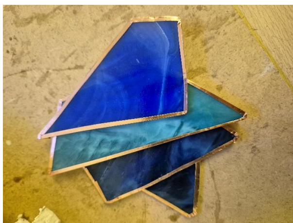
Slika br. 7, Gombar J., obloženo staklo, 2024.

Kod izrade odlučila sam se za neprozirno staklo koje će zadržavati svjetlo koje će se nalaziti unutar svjetiljke.