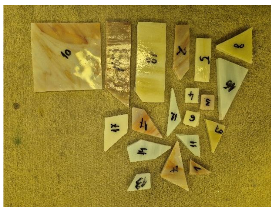
Slika br. 1., Gombar J., lem i staklo 2024. Slika br. 2., Gombar J., pripremljena stakla 2024.