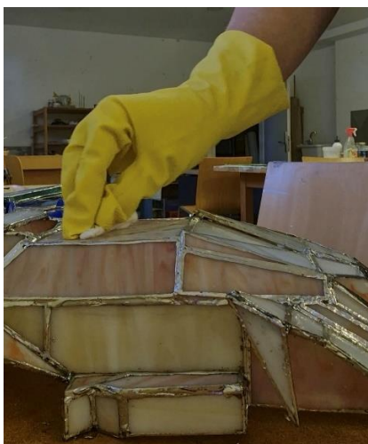
Slika br. 16, Gombar J., čišćenje stakla, 2024.

Nakon što smo spojili sve dijelove, uzimamo stopostotni aceton ili nitro razrjeđivač te skidamo ostatak paste koja je ostala od lemljenja. Nakon skidanja paste, rad prebrišemo sredstvom za staklo te su spojevi sa lemom spremni za daljnji postupak.