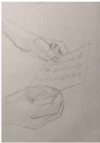
Kadar 9 Dobiva pismo od bratića Ekstremno krupni plan/detalj