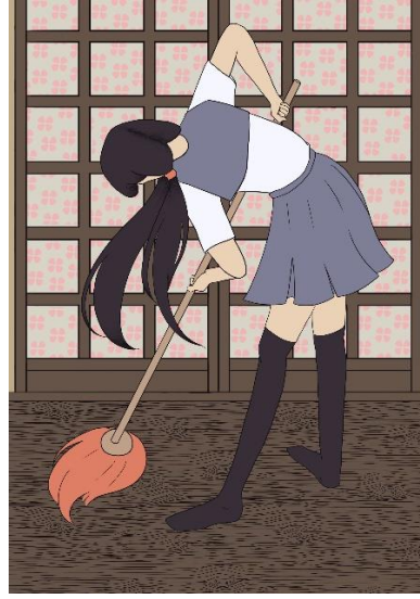
Slika 10. Ilustracija broj 6