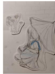
Kadar 4 Pozira profesoru za sliku Bliski plan, blag gornji rakurs