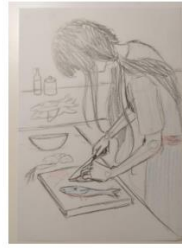
Kadar 8 Kuha večeru za goste Bliski plan