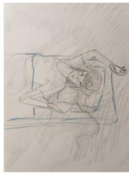
Kadar 1 Budi se u jutro Bliski plan, blag gornji rakurs