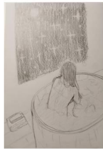
Kadar 10 Kupka Srednji plan