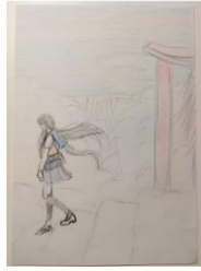
Kadar 6 Odlazi kući Srednji plan