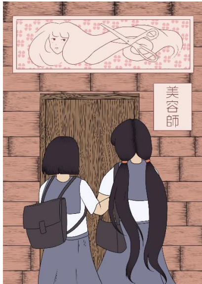
Slika 8. Ilustracija broj 4