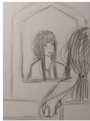
Kadar 2 Uređuje se tužna i umorna za školu Bliski plan, preko ramena