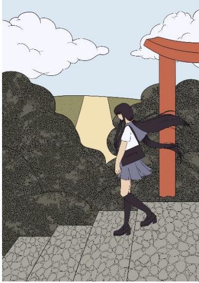
Slika 9. Ilustracija broj 5