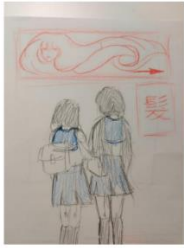
Kadar 5 Odlazi s Kinko k frizeru Bliski plan, double