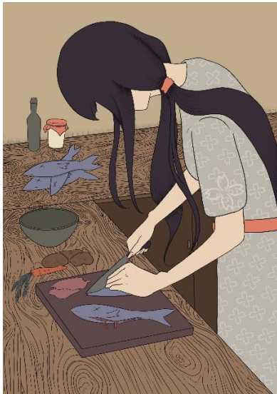
Slika 11. Ilustracija broj 7