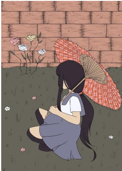
Slika 7. Ilustracija broj 3