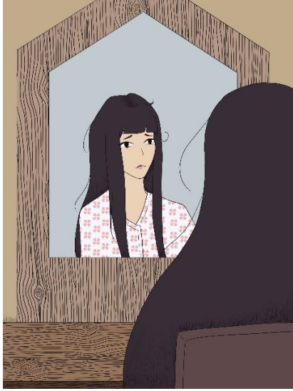
Slika 5. Ilustracija broj 1