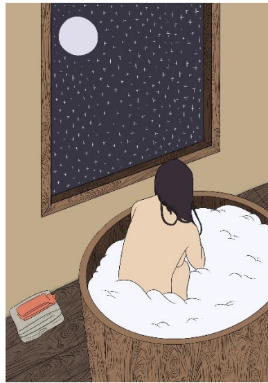
Slika 12. Ilustracija broj 8