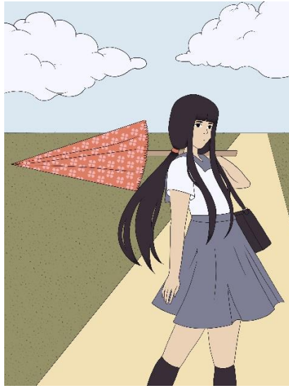
Slika 6. Ilustracija broj 2