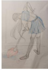
Kadar 7 Čisti kuću Srednji plan