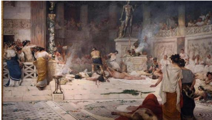
Celestin Medović, Bakanal , 1893.

često u bile prožete povijesnim i kulturnim značenjem, donoseći promatračima osjećaj putovanja kroz vrijeme i prostor.