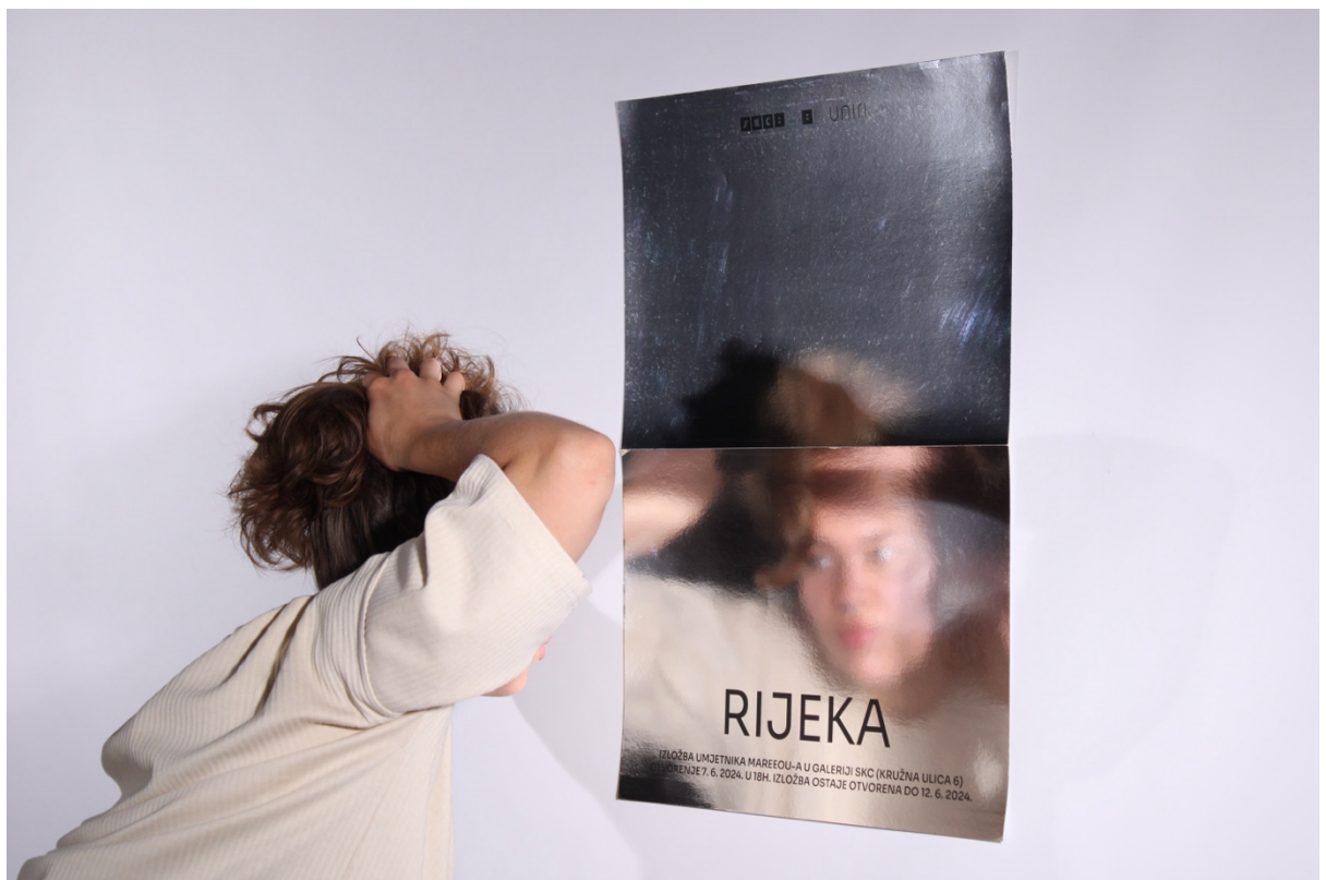
Slika 2 - Prikaz plakata s odrazom modela u reflektirajućem papiru