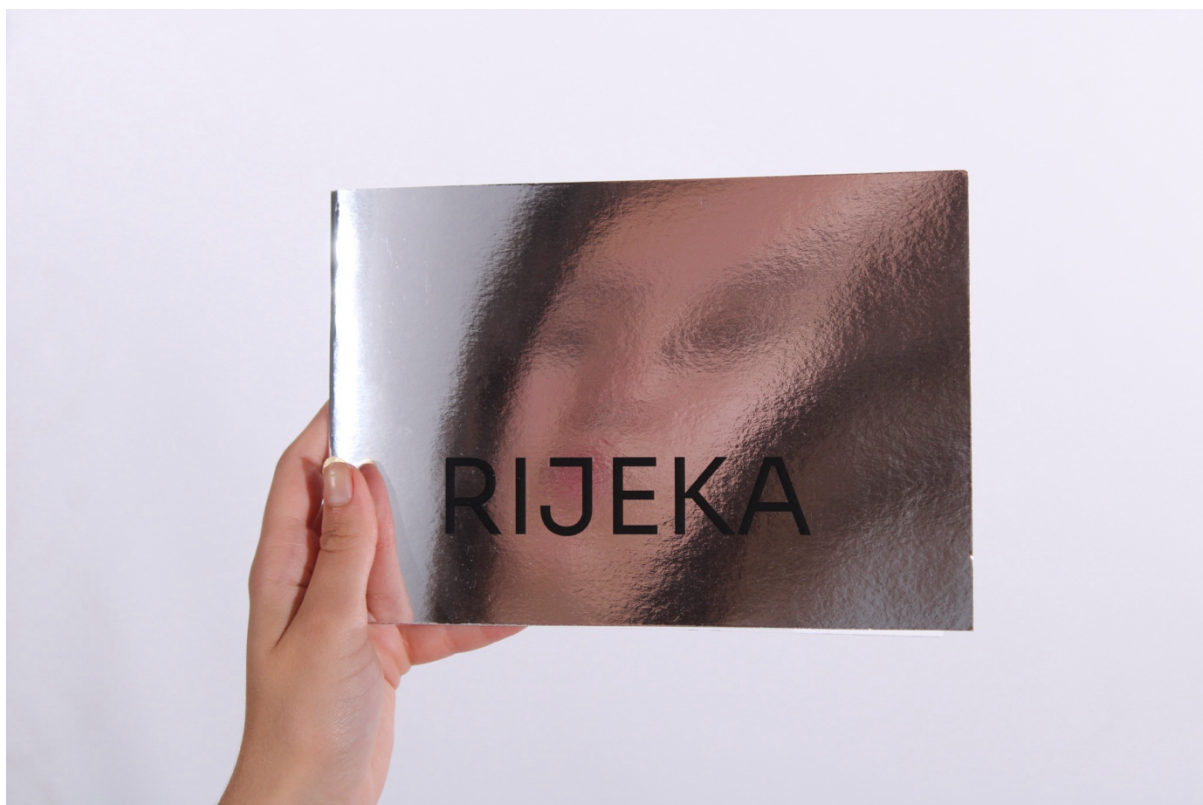
Slika 7 - Prikaz prednje strane kataloga s odrazom lica modela u reflektirajućem papiru