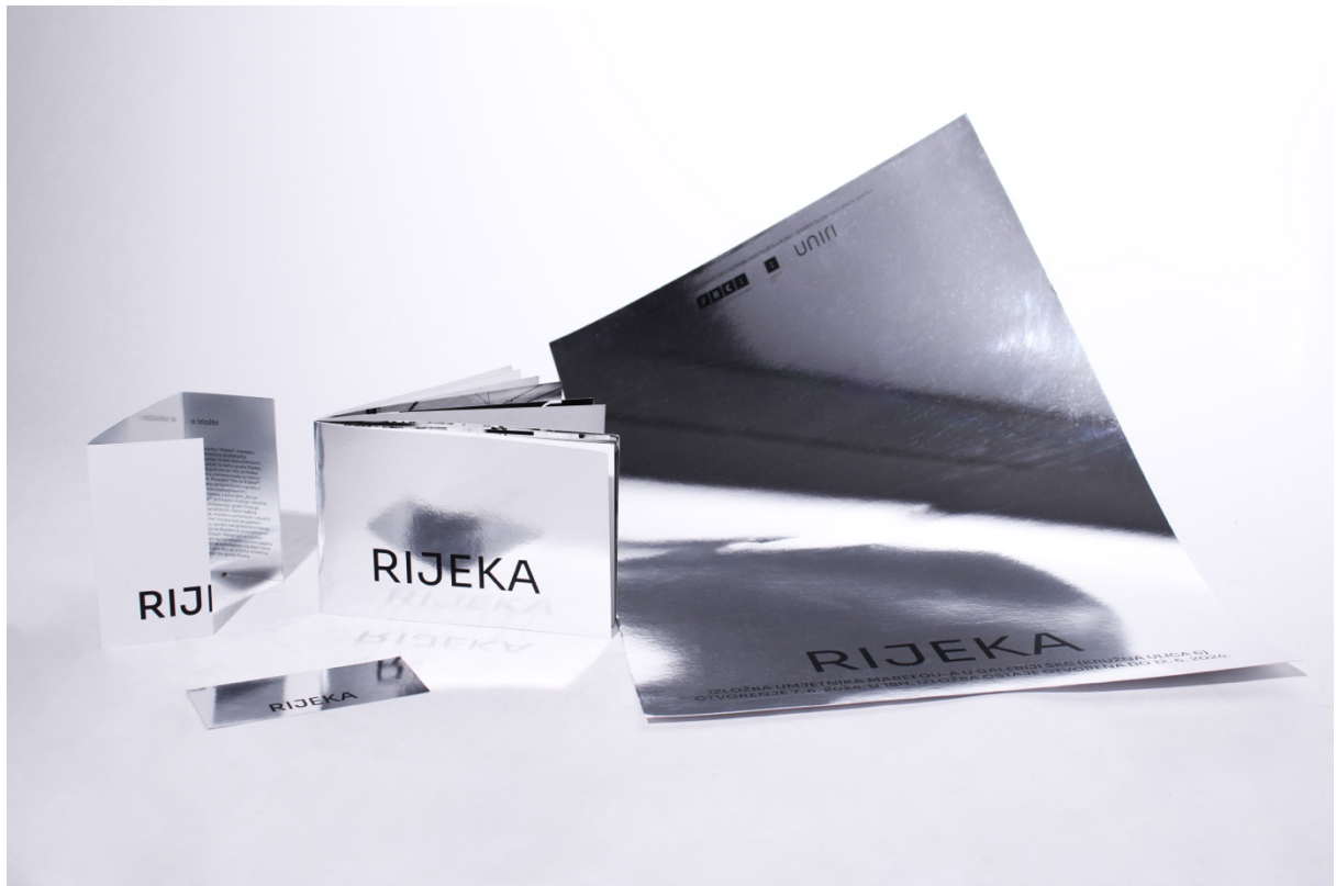
Slika 1 - Prikaz vizualnog identiteta izložbe na printanim promotivnim materijalima