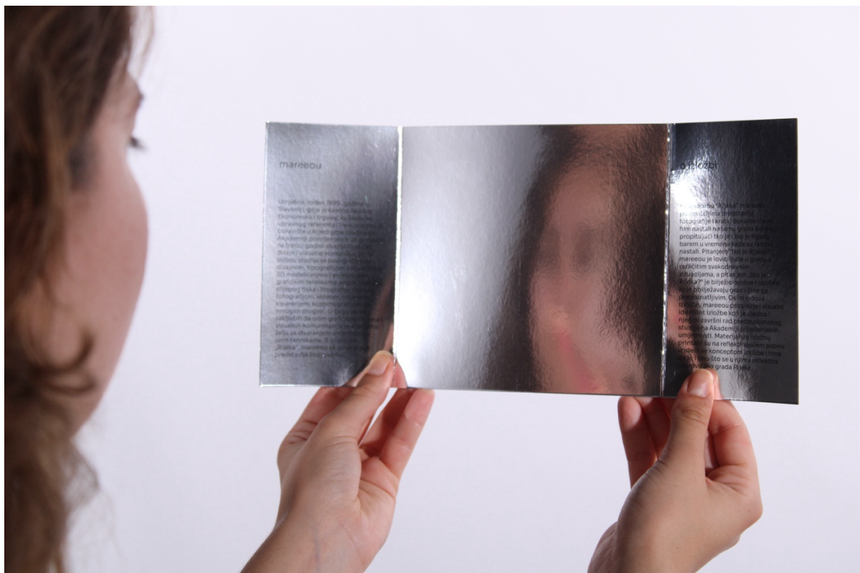
Slika 4 - Prikaz otvorenog deplijana s odrazom modela u reflektirajućem papiru