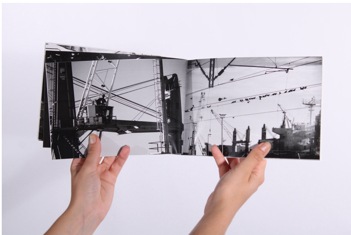
Slika 8 - Prikaz otvorenog kataloga s fotografijama koje su izlagane na izložbi