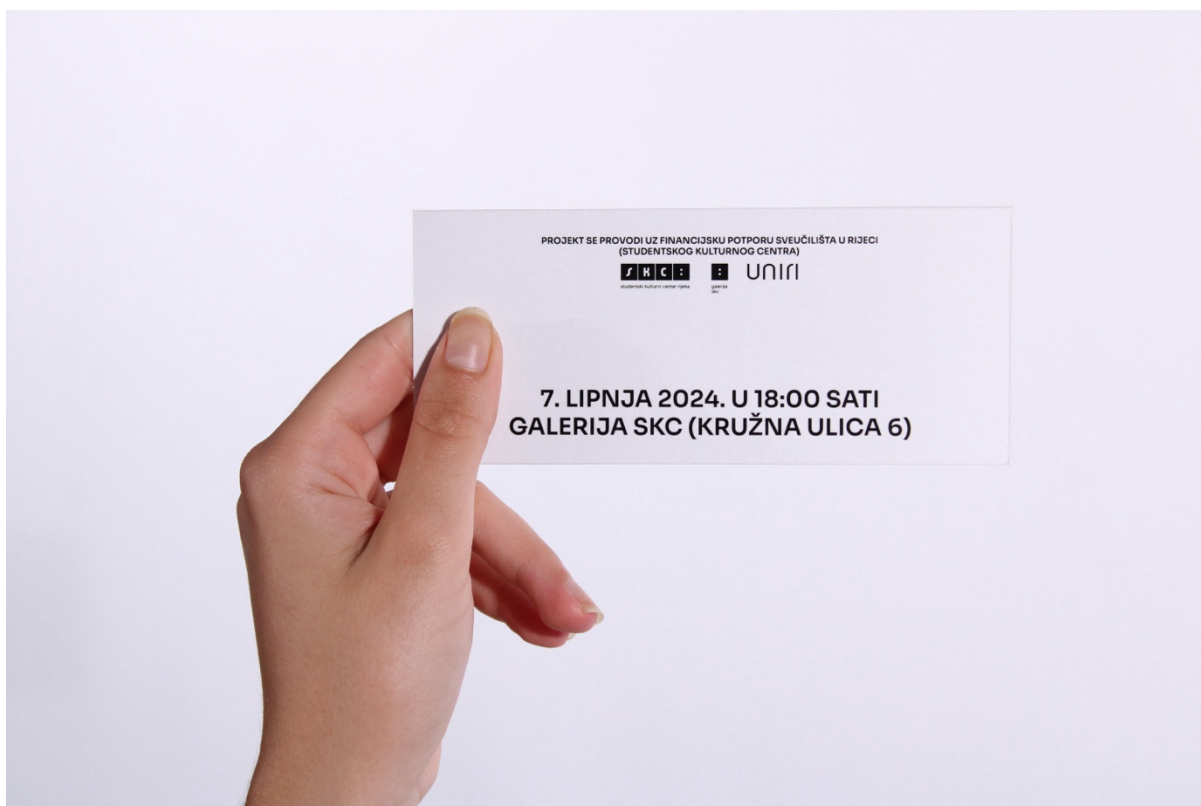
Slika 6 - Prikaz stražnje strane pozivnice