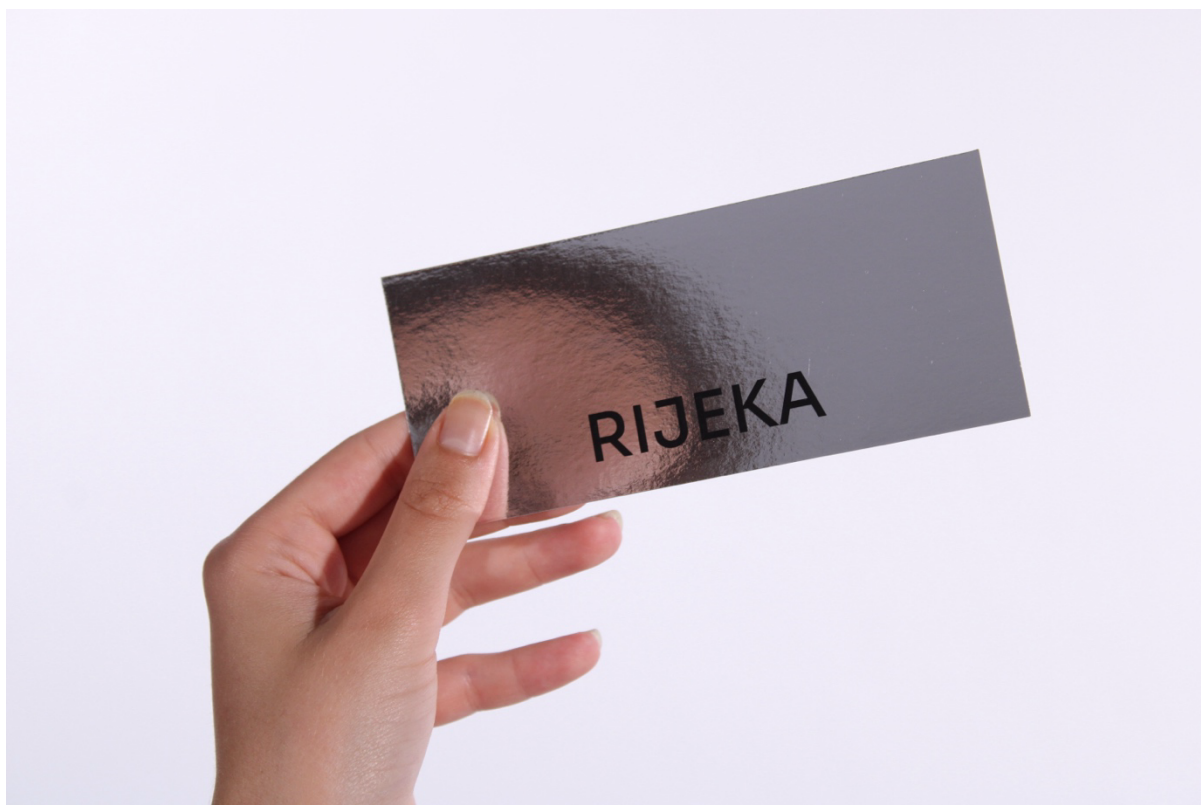
Slika 5 - Prikaz prednje strane pozivnice s odrazom glave modela u reflektirajućem papiru