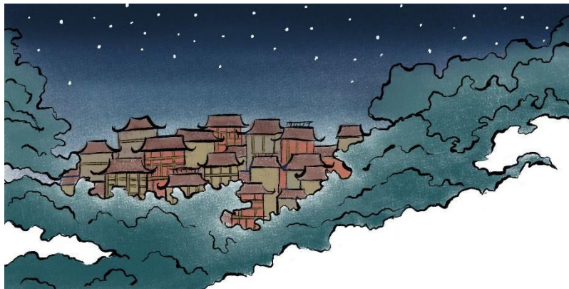
Slika 6. Primjer upotrebe negativnog prostora