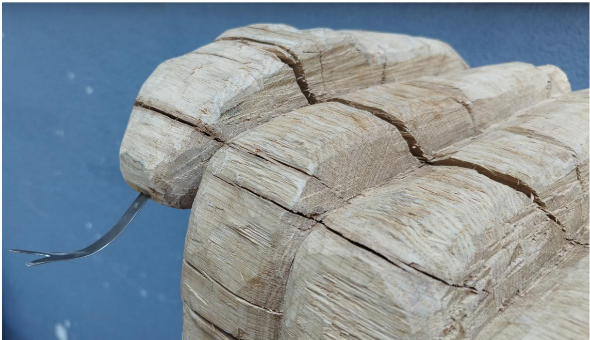
Slike završenoga rada „Staircase to Heaven“, Ivona Čolakovac