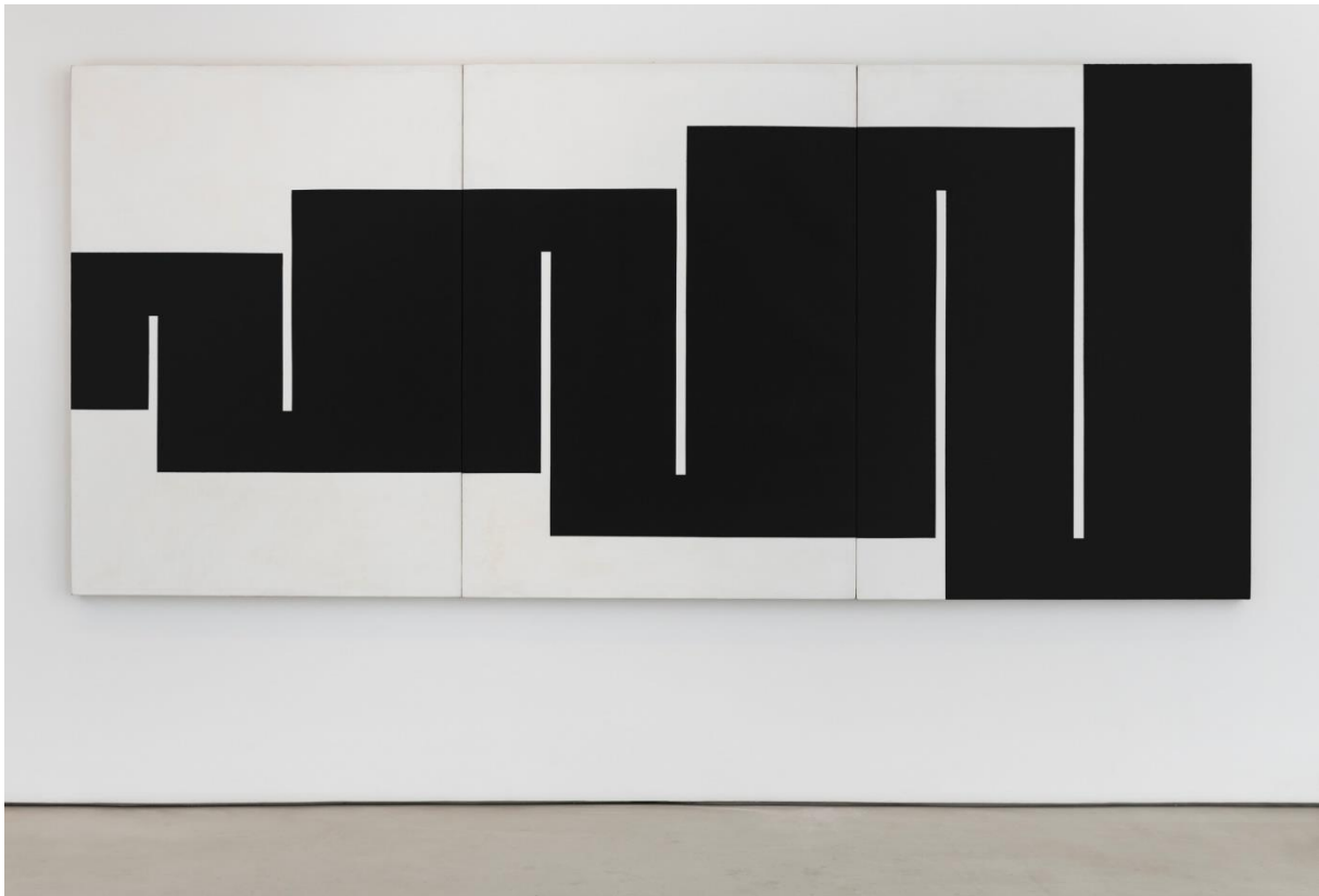
Julije Knifer, H.d Tü tri v., 1975., akril na platnu, trodjelno (svaki dio 170.2 x 124.1 cm)