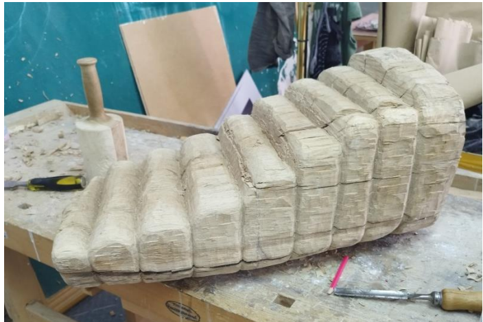
Slike rada u procesu izrade, Ivona Čolakovac