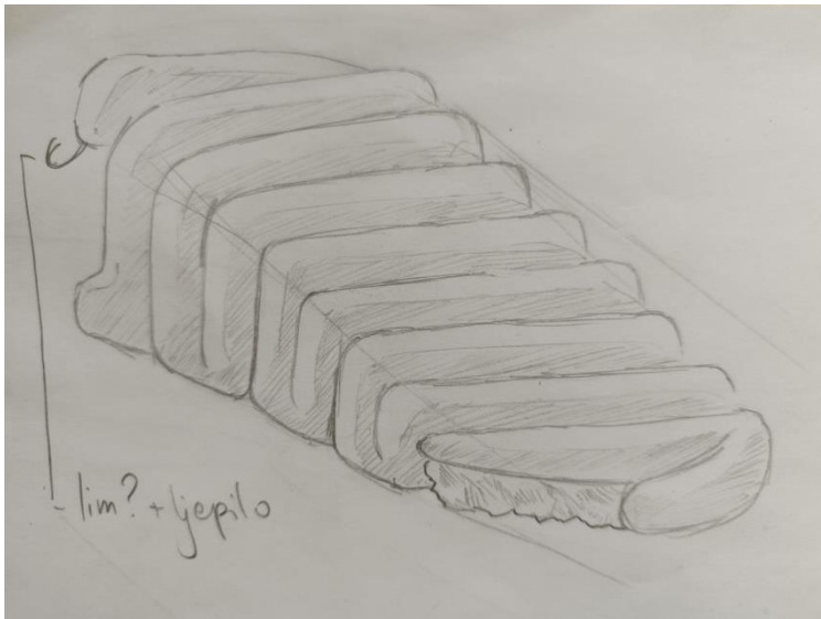
Izmjena u skici, Ivona Čolakovac

Zbog prirodnog oblika drva i njegovog pucanja odlučih se za izmjenu skice te pojednostavljenja oblika glave te micanja detalja koji bi mogli uzrokovati daljnje pucanje drva ili čak mogući odlom istoga. Kao zamjena za detalje u samome drvu koji bi glavu zmiije dočarali kao zmiiju dodan je metalni jezičak koji ujedno i paše uz jednostavnost čitave forme.