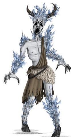
Slika 9. Finalna ilustracija čudovišta