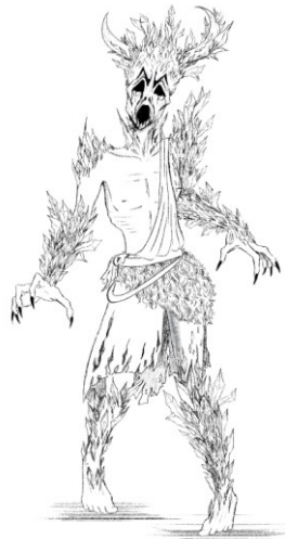
Slika 5. Finalna skica čudovišta