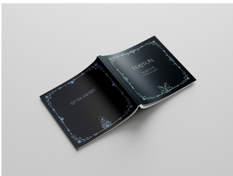
Slika 12. Mockup, korice artbooka