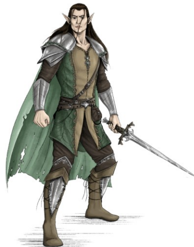
Slika 7. Finalna ilustracija vilenjaka