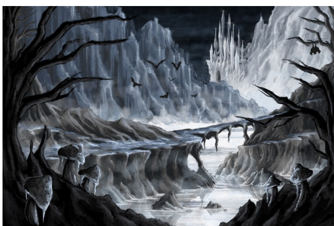
Slika 11. Finalna ilustracija negativnog okoliša