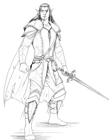
Slika 3. Finalna skica vilenjaka