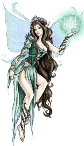
Slika 6. Finalna ilustracija vile