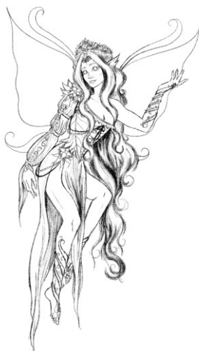
Slika 2. Finalna skica vile