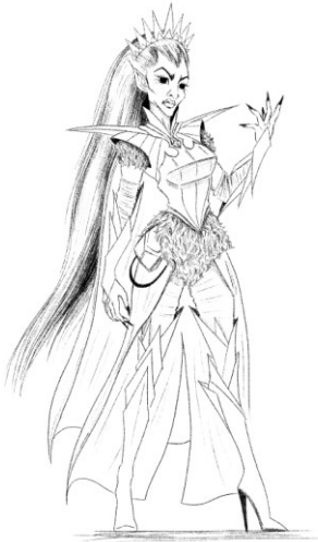
Slika 4. Finalna skica vještice