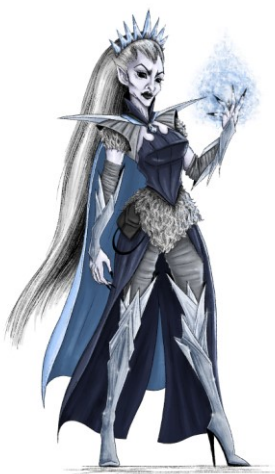
Slika 8. Finalna ilustracija vještice