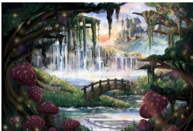
Slika 10. Finalna ilustracija pozitivnog okoliša