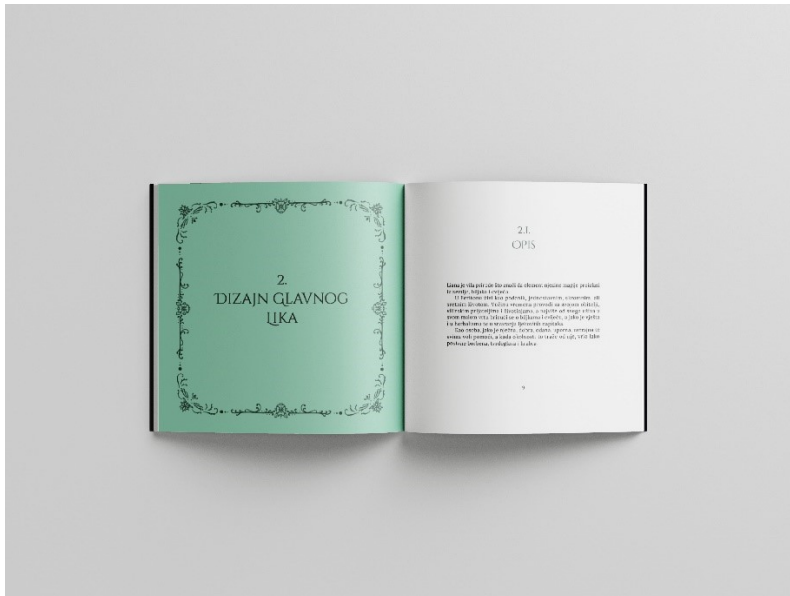
Slika 13. Mockup, prijelom artbooka, str. 8 - 9