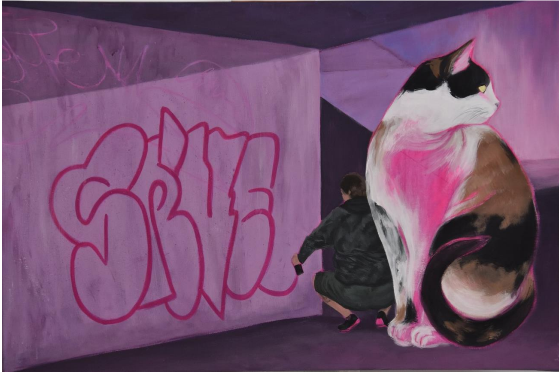
Mijić, L., Noćne šetnje #3, 120x80 cm, akril na platnu, 2024.