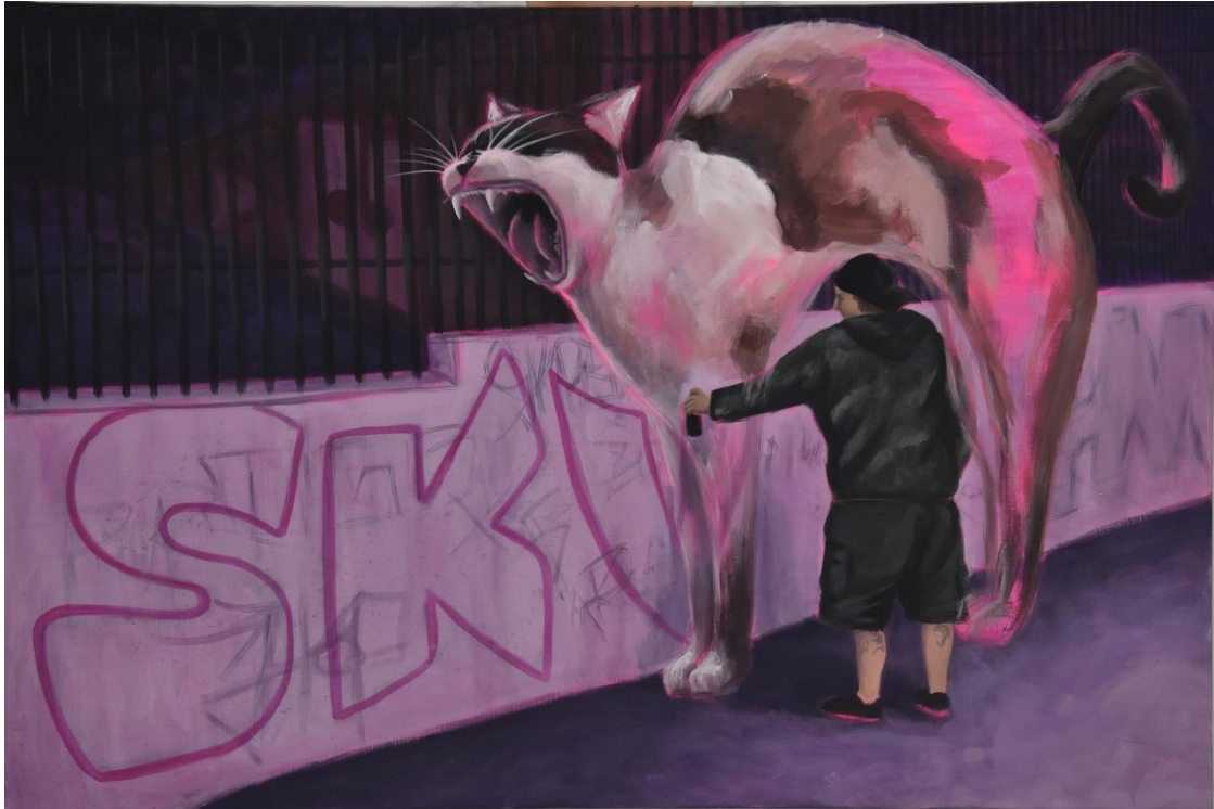
Mijić, L., Noćne šetnje #1, 120x80 cm, akril na platnu, 2024.