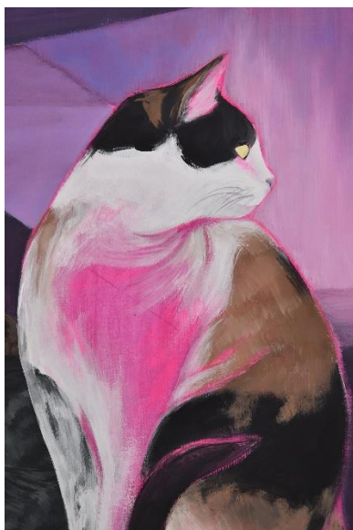
Mijić, L., detalj Noćne šetnje #3, 120x80 cm, akril na platnu, 2024.