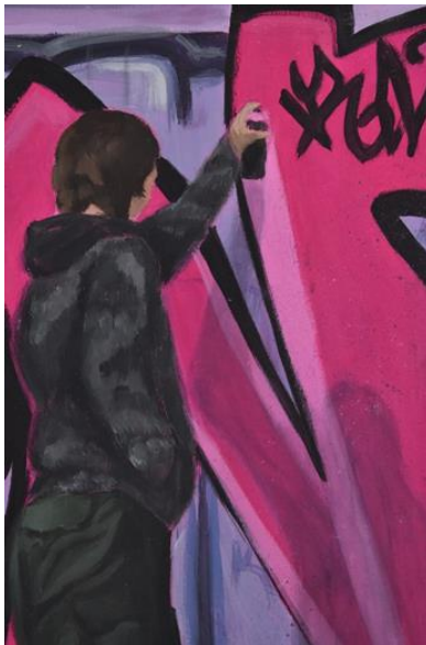
Mijić, L., detalj Noćne šetnje #2, 120x80 cm, akril na platnu, 2024.