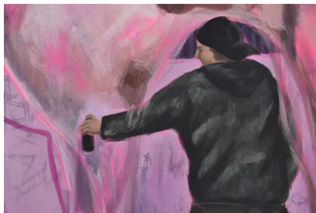
Mijić, L., detalj Noćne šetnje #1, 120x80 cm, akril na platnu, 2024.