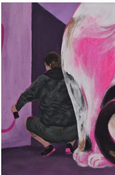
Mijić, L., detalj Noćne šetnje #3, 120x80 cm, akril na platnu, 2024.