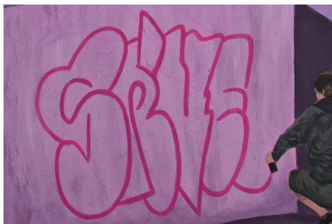
Mijić, L., detalj Noćne šetnje #3, 120x80 cm, akril na platnu, 2024.