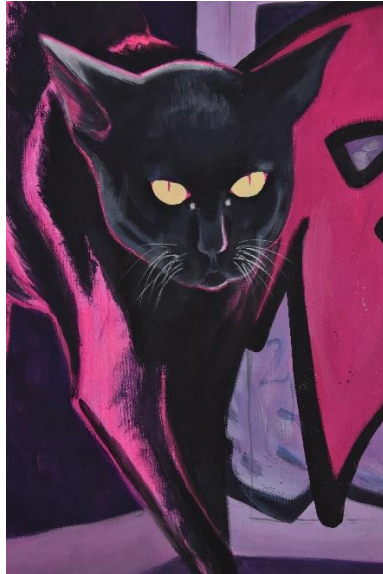
Mijić, L., detalj Noćne šetnje #2, 120x80 cm, akril na platnu, 2024.