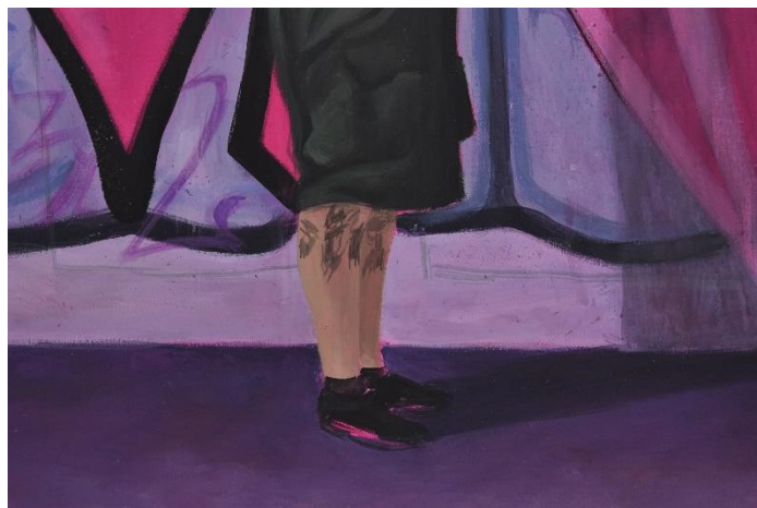
Mijić, L., detalj Noćne šetnje #2, 120x80 cm, akril na platnu, 2024.