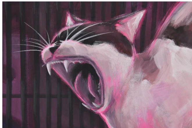
Mijić, L., detalj Noćne šetnje #1, 120x80 cm, akril na platnu, 2024.