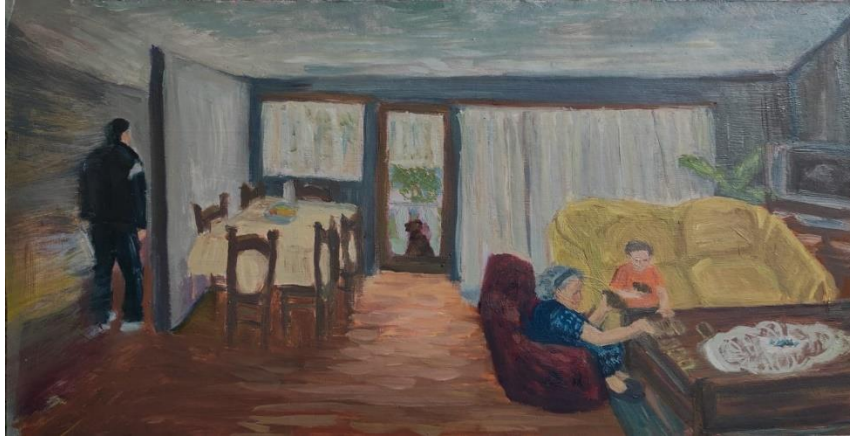
Brajković, L_ Sjećanja_#1 Opet si pobedio ,28x 50 cm, ulje na medijapan ploči, 2024.