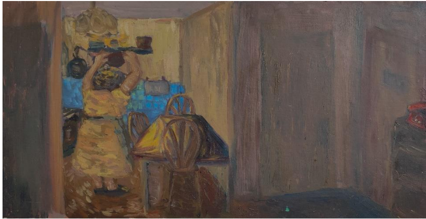
Brajković, L_ Sjećanja_#2 Teta Marta, 28 x 50cm, ulje na medijapan ploči, 2024