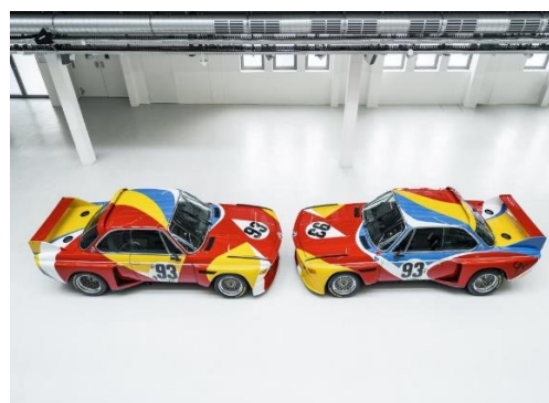
Slika br. 3., 4., Alexander S.C Cadler BMW Art Car, Neue National galerie, Berlin