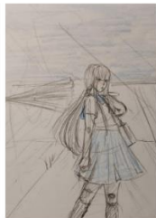
Kadar 3 Odlazi u školu Bliski plan, u razini očista