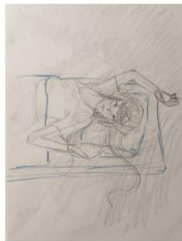
Kadar 1 Budi se u jutro Bliski plan, blag gornji rakurs