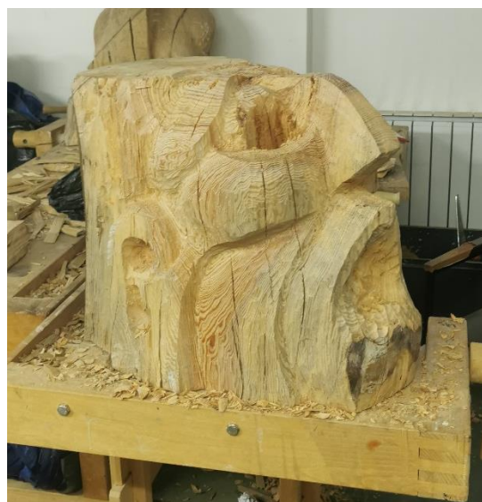
Prikaz faza rezbarenja