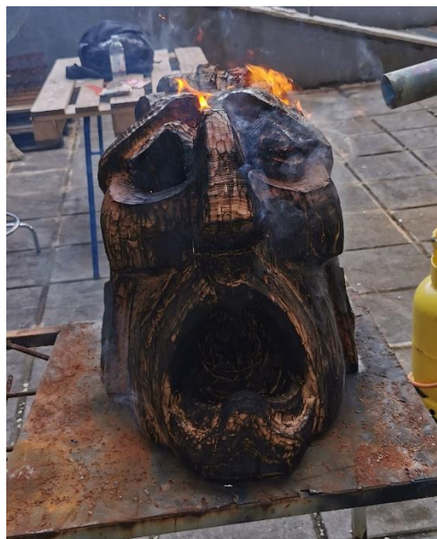
Dovršena skulptura i paljenje

Konačno metalnom četkom skinuta je čađ koja je nastala prilikom paljenja nakon čega je skulptura bila spremna za izlaganje.