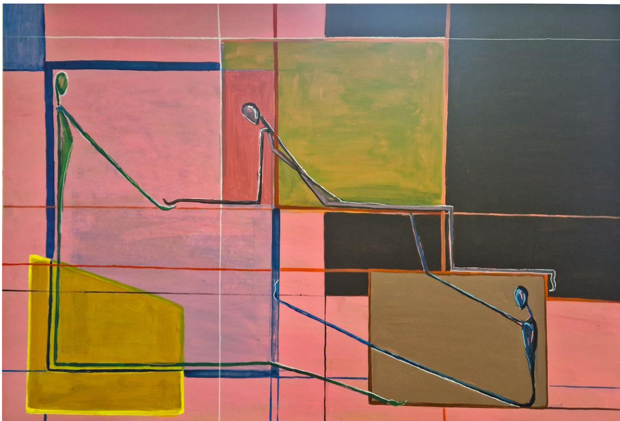
„Okviri“, kombinirana tehnika, 2024.