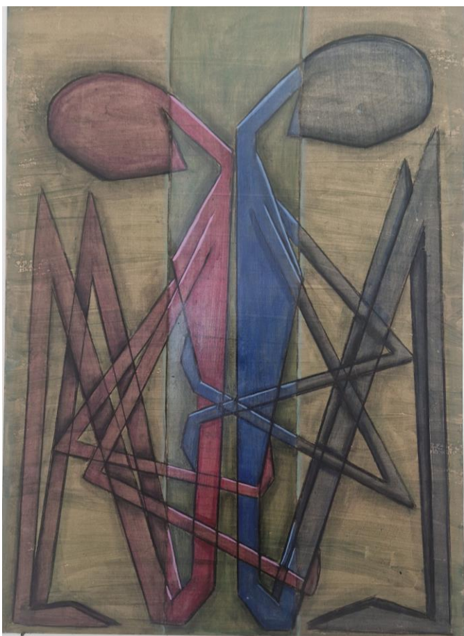
„Zagrljaj“, kombinirana tehnika, 2024.

Koristila sam razne slikarske i crtačke tehnike poput akrila, akvarela, ugljena i krede. Većina slika je naslikana su na podlozi od medijapana, no slikala sam i na platnu gdje sam osim akrila koristila i konac. Tako je linija postala trodimenzionalna, no na kraju sve su slike plošne, bez puno volumena, samo svjetlije i tamnije linije pokazuju izvor svijetla i sugeriraju sjene.