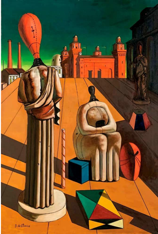
„Uznemirujuće muze“, 97.16 x 66 cm, ulje na platnu, 1916. – 1918.