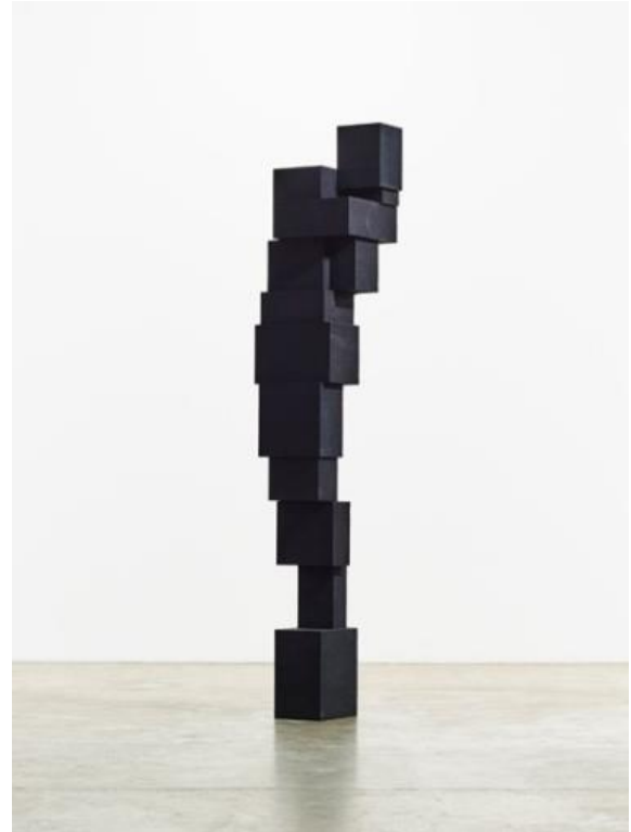
„Big space“, 2014., lijevano željezo, 311.5 x 69 x 55.5