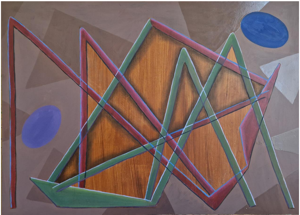
„Sukob“, kombinirana tehnika, 2024.