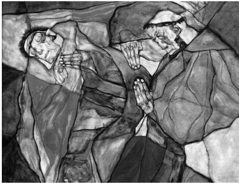
Egon Schiele, „Agonija“, 1912.

Egon Schiele, austrijski slikar i grafičar, poznat je po svom ekspresionističkom stilu, izražajnim linijama i često distorziranom prikazu ljudske figure. Svoj rad povezujem s njegovim jer i njegovi portreti i autoportreti otkrivaju unutarnje stanje modela. Kao i u Schieleovom, i u mom radu su prisutni alegorijski portreti/autoportreti. Schieleova djela često istražuju osobne i intimne teme, što je prisutno i u mome radu kroz prikaz odnosa s majkom i prijateljicama. 9