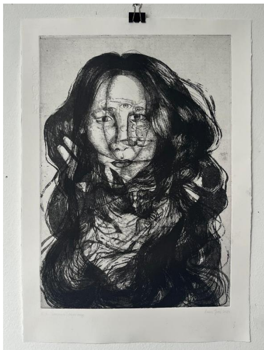
„Zaštita i Sloboda“, završni otisak

Ovi novi radovi vizualno prenose kako su se odnosi preplitali i transformirali kroz različite faze života, naglašavajući dinamičku prirodu ljudskih veza i njihov utjecaj na formiranje identiteta. Preklapanjem simbola, poput kose, ruku i ptice, stvorena je narativna tekstura koja dodatno obogaćuje razumijevanje psiholoških i emocionalnih aspekata tih odnosa.