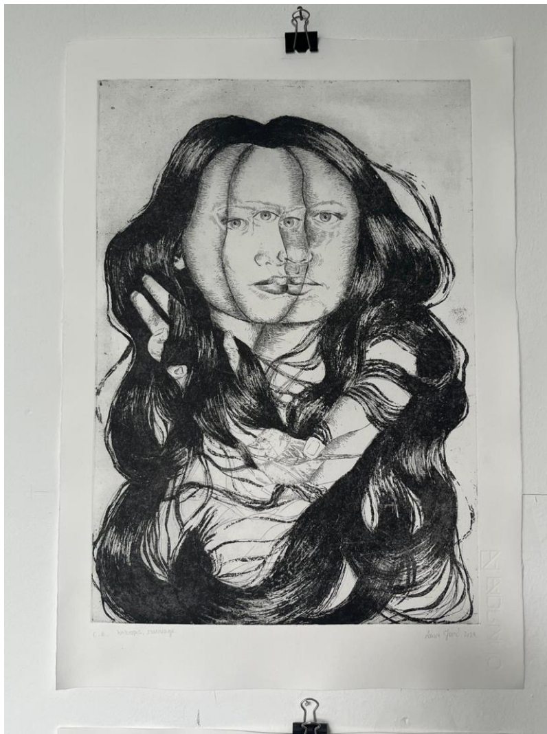
Matrica 2: „Sloboda“, završni otisak

Iako u radu nema moga autoportreta, djelo istražuje utjecaj majke na mene, sugerirajući kako su majčina zarobljenost i samosabotaža imali duboki psihološki utjecaj na mene kroz odrastanje.