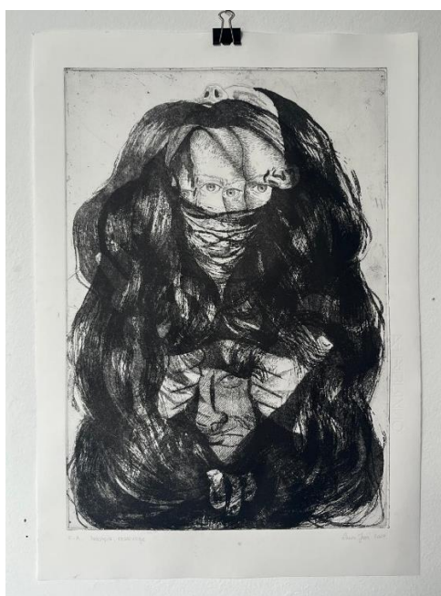
„Sloboda i Utjecaj“, završni otisak