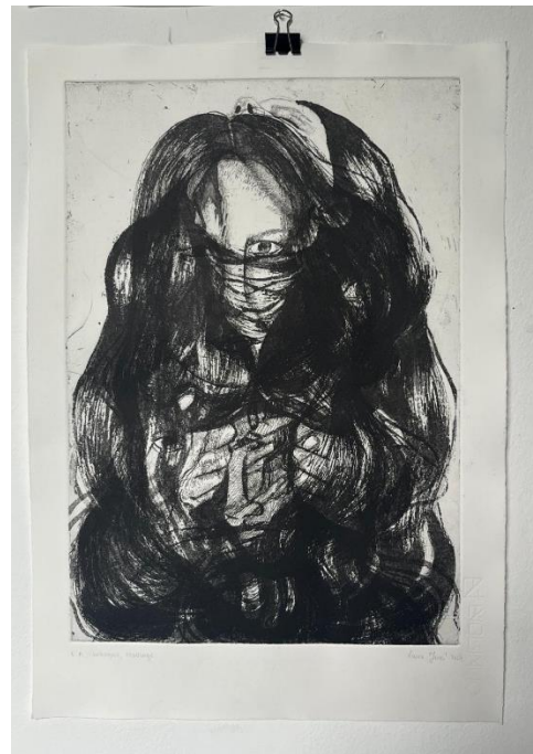
Zaštita i Utjecaj“, završni otisak