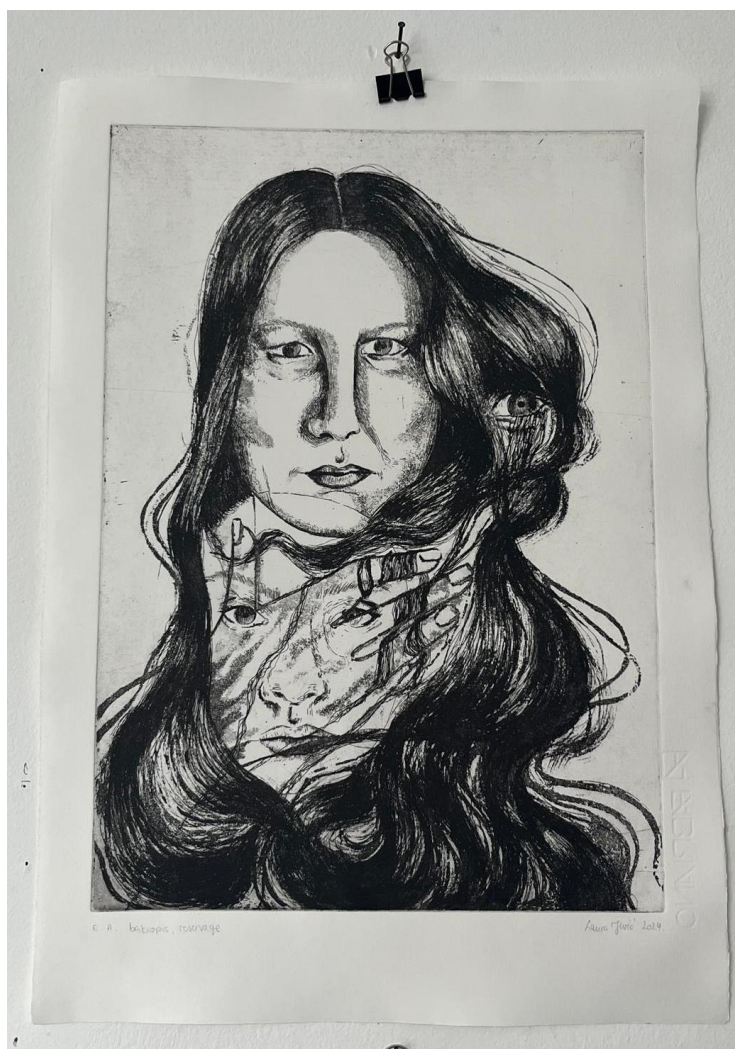
Matrica 1: „Zaštita“, završni otisak

Pogled prijateljice je vrlo bitan i upečatljiv, te se u gornjem desnom kutu nalazi njeno oko iz djetinjstva, naglašavajući nježnu stranu. Kosa dviju figura potpuno je isprepletana, sugerirajući nerazdvojnu povezanost dviju prijateljica. Tema prijateljstva istražena je kroz simboliku zaštite, povezanosti i zajedničkih iskustava.