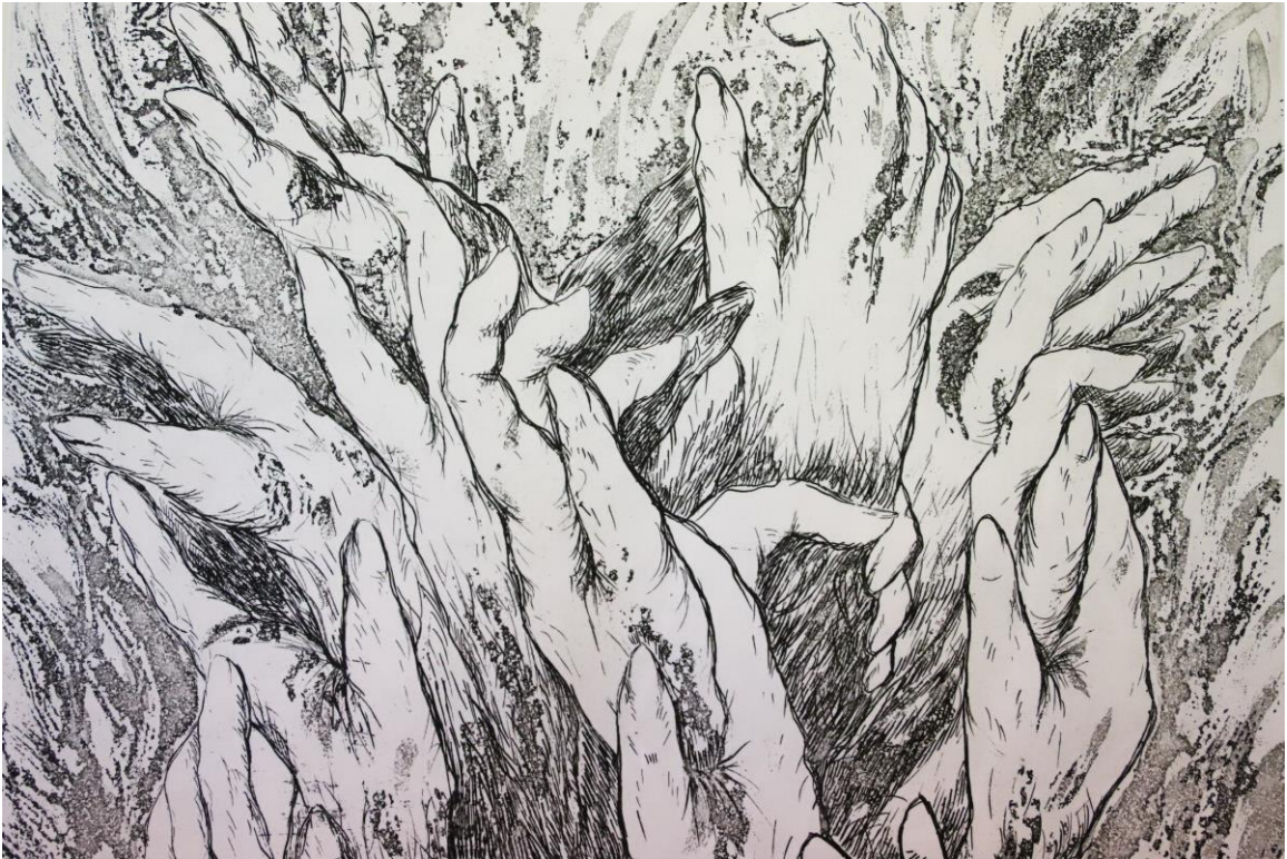
Slika 24. Detalj iz grafičkog lista „Zagrljaj“, kombinirana tehnika, Petra Arežina, 2023.