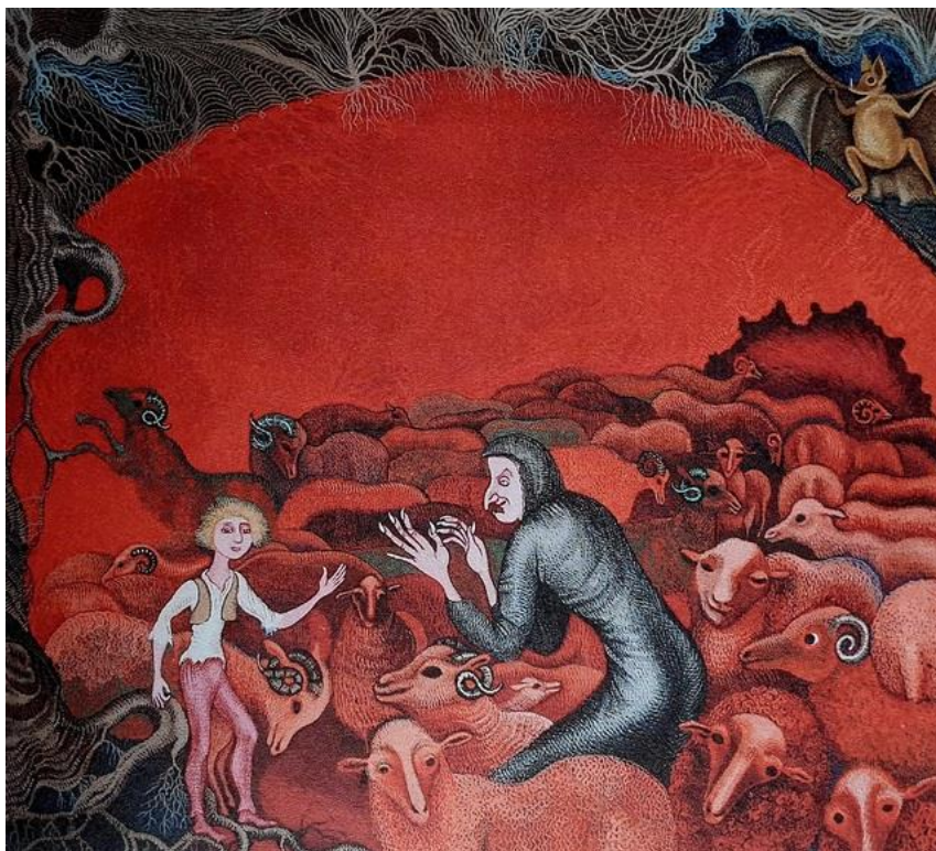
Slika 6. Ilustracija za priču "Jagor" Ivane Brlić Mažuranić, 1970.

Proučavajući razne umjetnice u crtačkom mediju pozvala bih se na djela Cvijete Job. Slikarica i ilustratorica minijatura Cvijeta Job rođena 6. kolovoza 1924., a umrla je 18. lipnja 2013. godine. Bavila se slikanjem minijatura koje su je nadahnjivale, a posebice onima srednjovjekovne rane renesanse. Najveći ilustratorski opus Cvijete Job bile su pripovijetke Ivane Brlić Mažuranić. U svojim minijaturama često koristi elemente nadrealizma. 37 Hrvatskoj je javnosti najpoznatija po ilustracijama dječjih knjiga kao što su Puškinove i Andersenove bajke, slikovnice prema pričama Ivane Brlić-Mažuranić, poznatu bajku Petra P. Jeršova „Konjić Grbonjić“, „Lovačke zapise“ Ivana Sergejeviča Turgenjeva i djela Petra Šegedina. 38