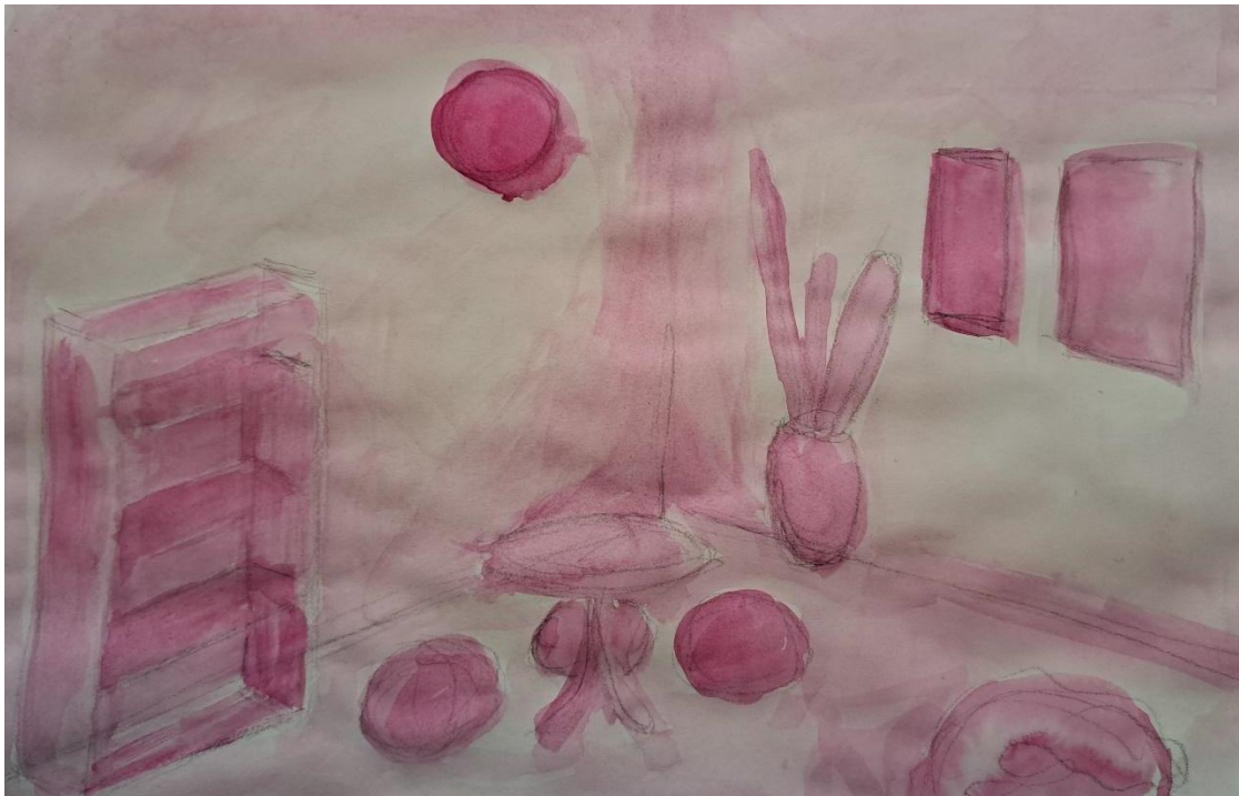
Slika 13 – Skica 2 – Tehnika akvarel, 2023. godine