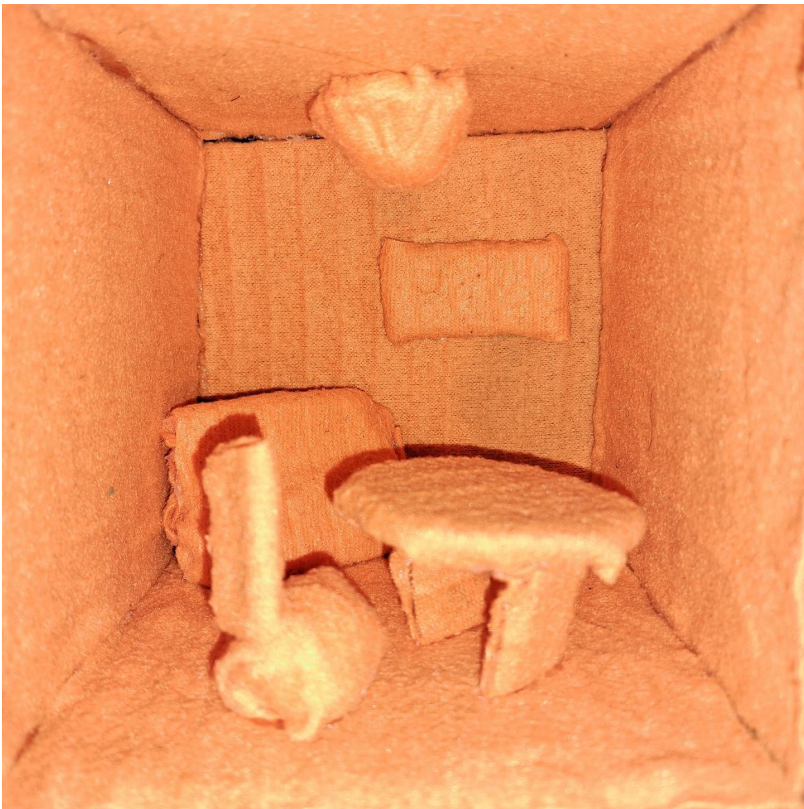
Slika 12 – Skica 1 – Maketa od kartona i deke, 2023. godine