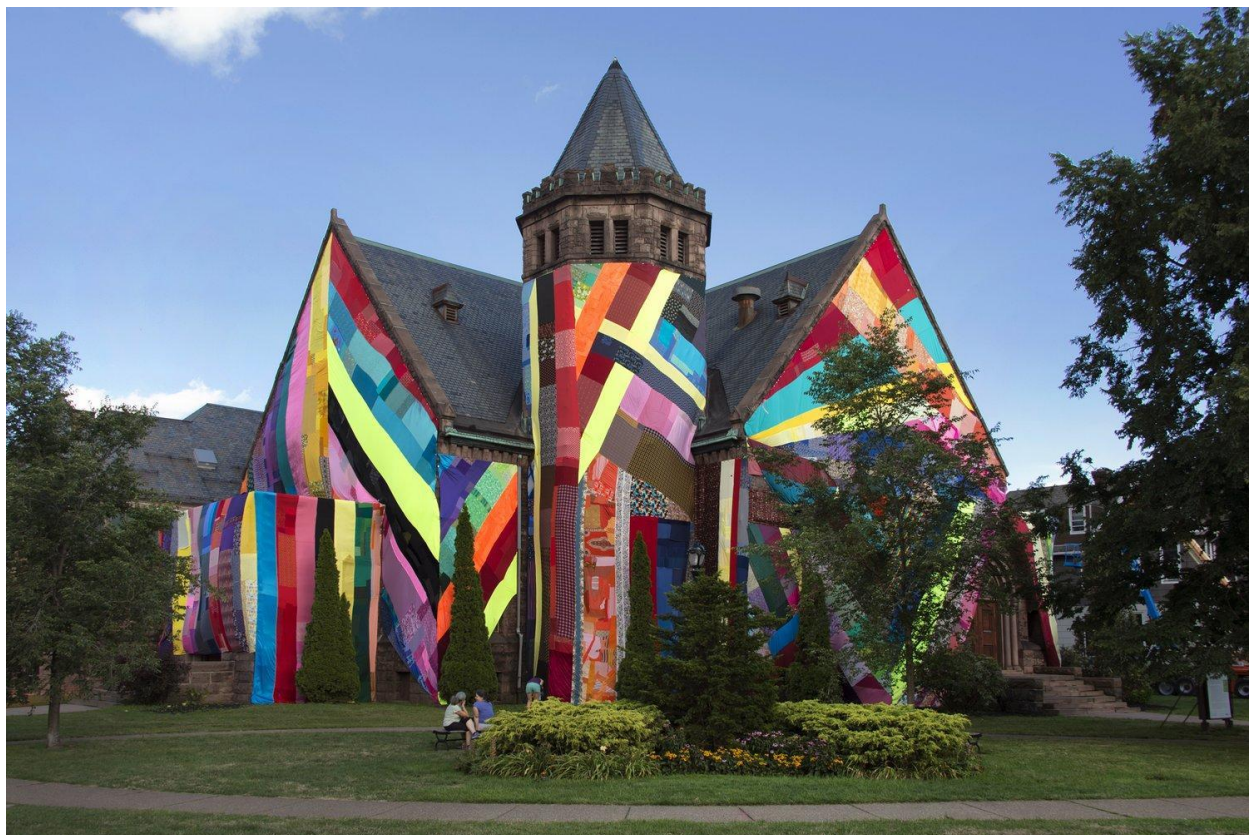
Slika 7 – „Spectral Locus“, 2016. godine – Crkva Richmond Ferry, Buffalo, New York