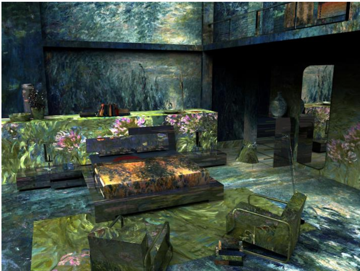
Slika 11 – “Brand New Paint Job“ - Monetova spavaća soba, 2013. godine