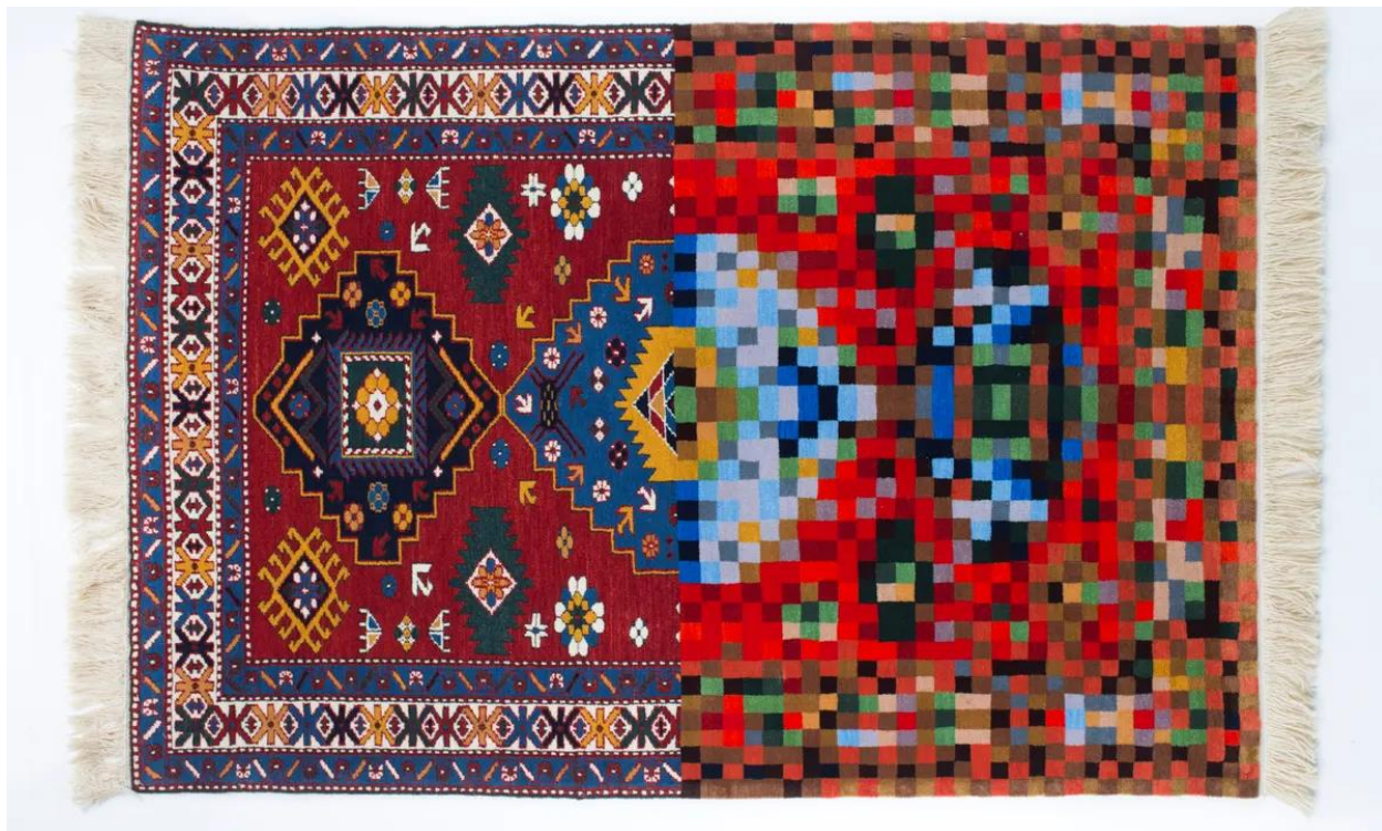
Slika 4 – „Tradition in pixel“, 2010. godine