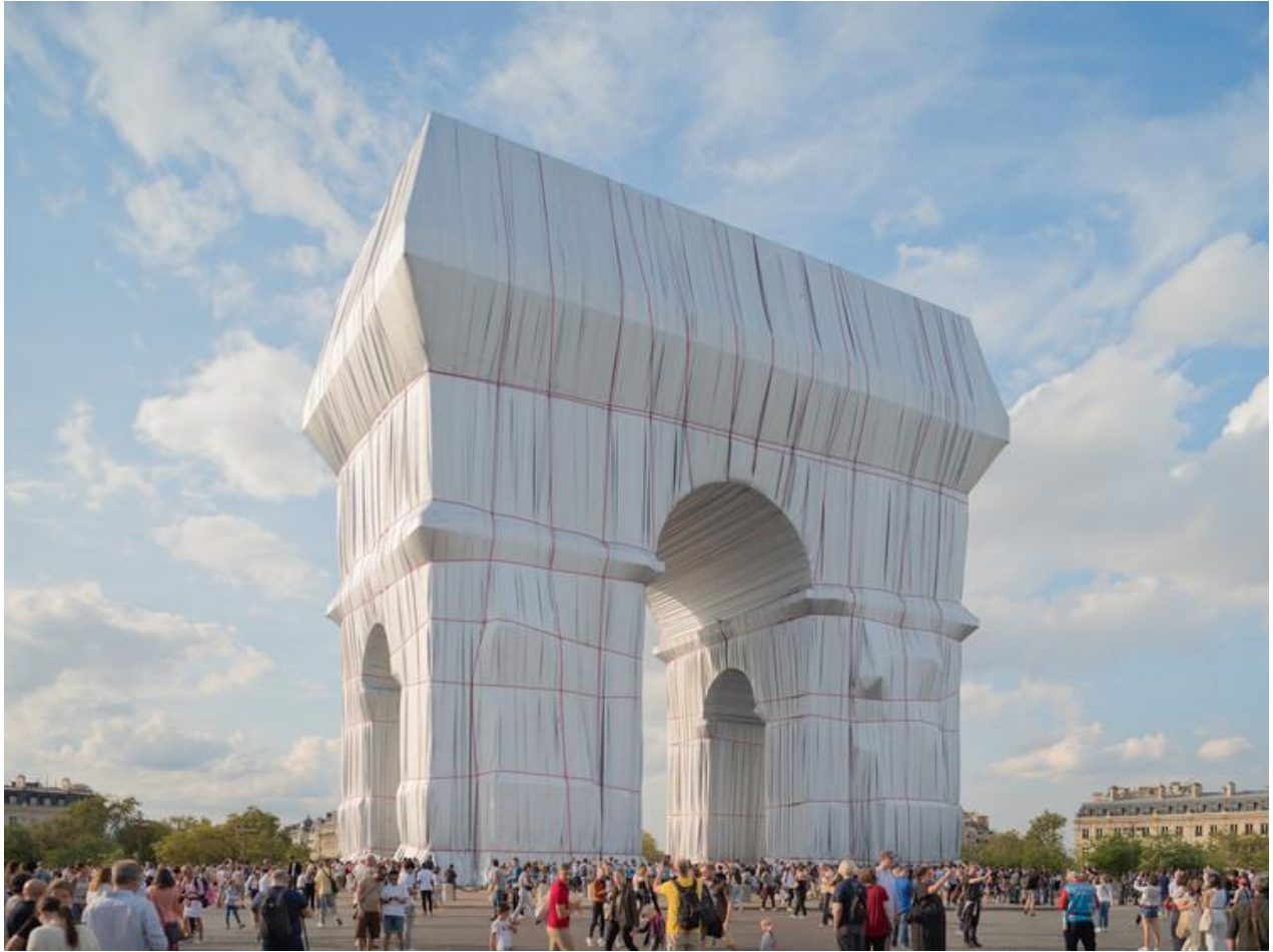
Slika 2 – „L'Arc de Triomphe, Wrapped“ , 1961. – 2021. godine