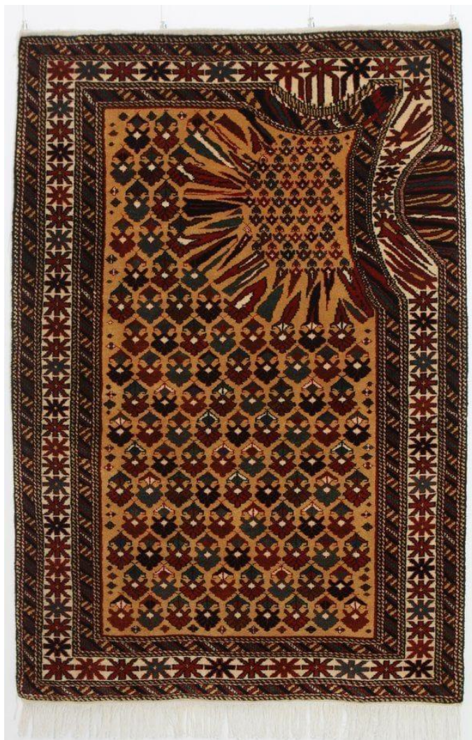
Slika 3 – „Hollow“, 2011. godine