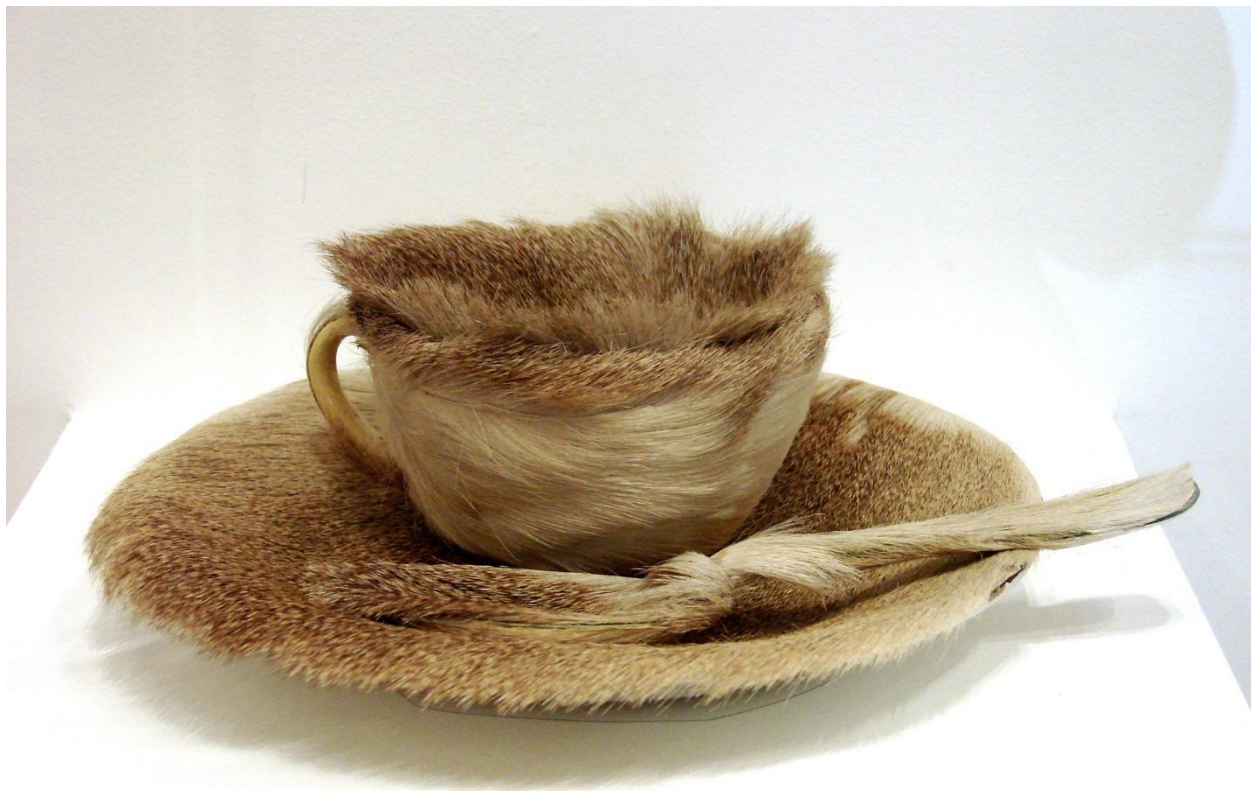
Slika 9 – „Object“, 1936. godine, Galerija Charles Ratton, Pariz