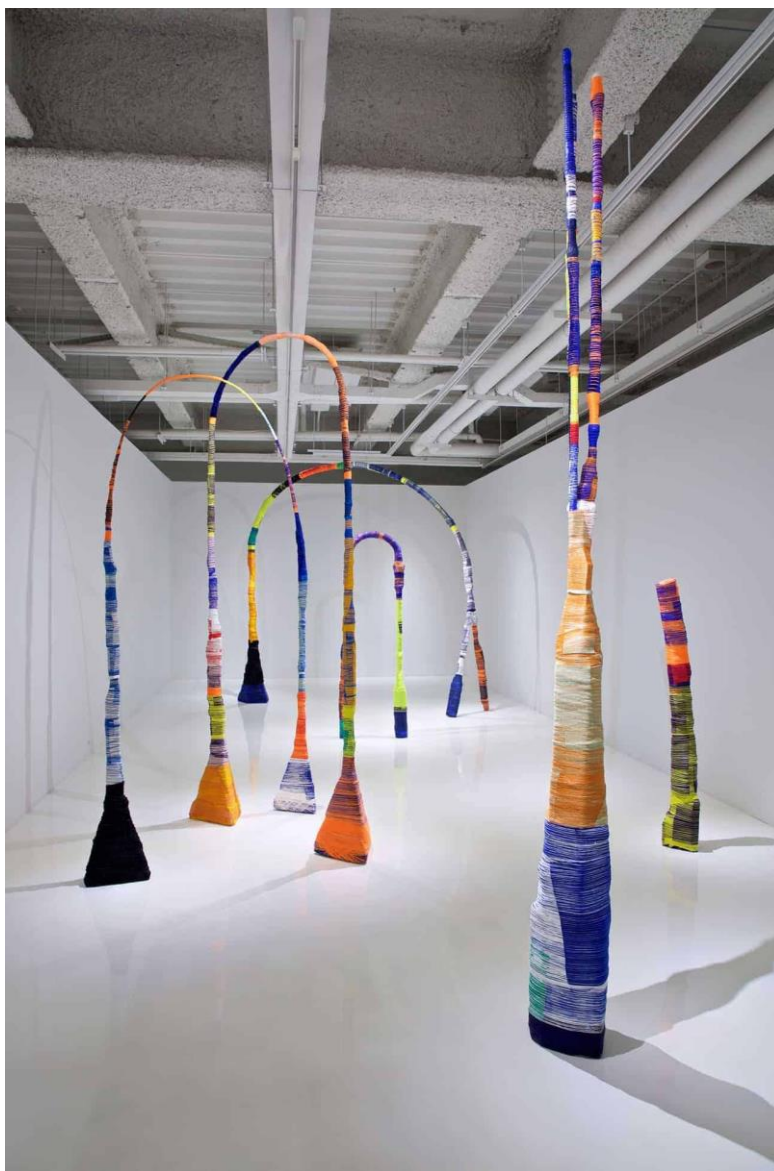
Slika 8 – „How long is a piece of thread“, 2016. godine