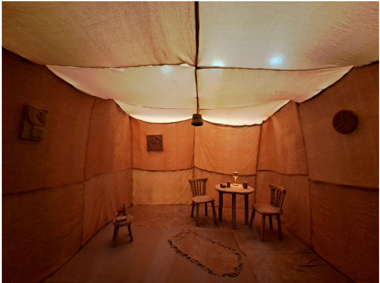
Slika 15 - Postav rada „Omekšani prostor“, Galerija SKC, 2024. godine