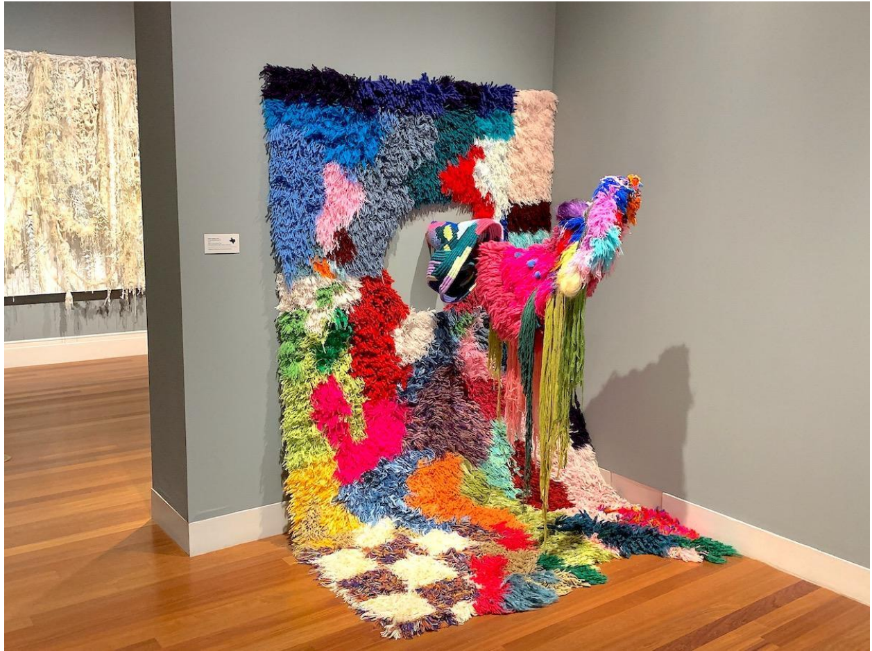
Slika 6 – „A little domestic waste IV“, 2017. godine