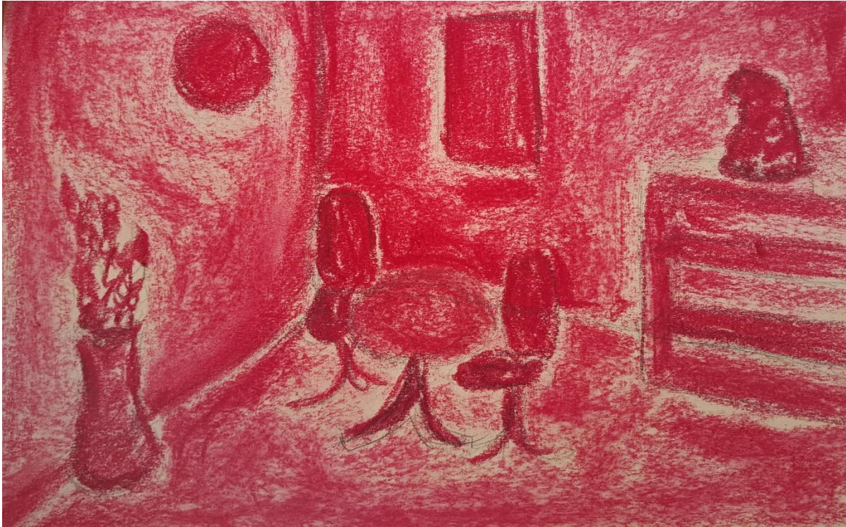
Slika 14 – Skica 3 – Tehnika pastele, 2023. godine