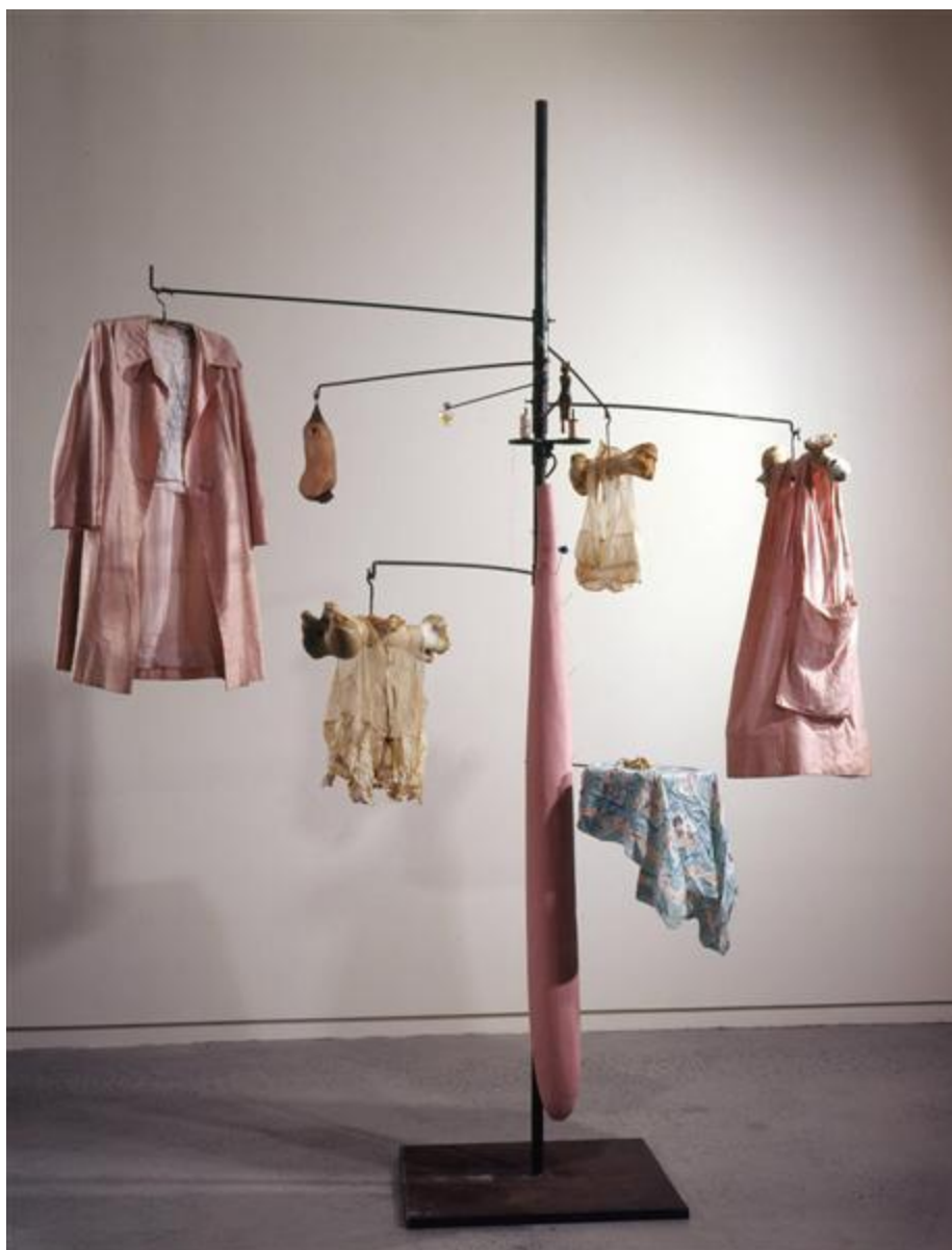
Slika 5 – „Pink Days and Blue Days“, 1997. godine