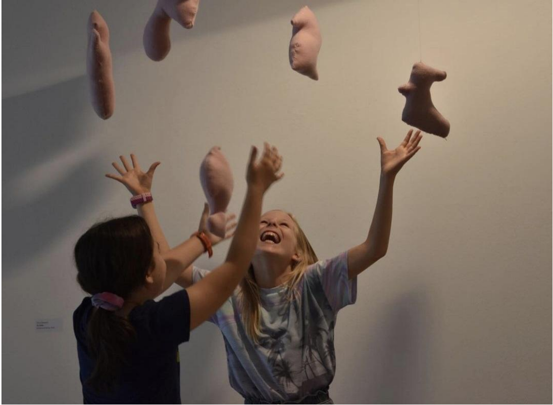
Slika 1 – „GJ 504b“ - Galerija Kortil, 2022. godine